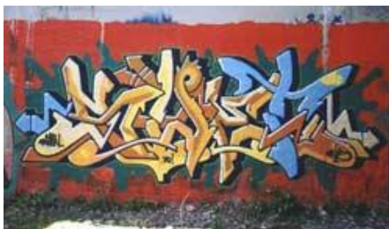
Graffiti Wild Style ( www.valladolidwebmusical.org/graffiti )

O acréscimo de símbolos, setas e espirais é a base do wild style 9 (estilo selvagem), um dos mais complexos tipos de de graffiti que surgiu durante a “guerra dos estilos” entre os autores. Dentre os muitos, faz-se necessário destacar RIFF 170.