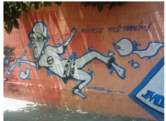
Os Formigas – Free Style Mural da Asmare – Barro Preto/BH