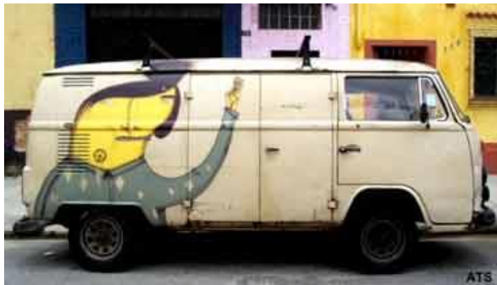
Os Gêmeos - São Paulo/1993