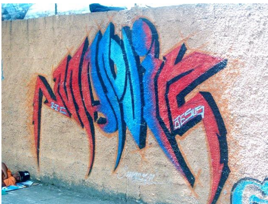
Marvin – Wild Style Mural da Asmare – Barro Preto/BH