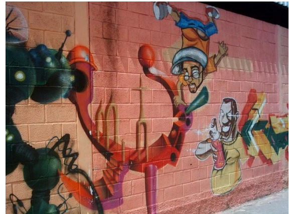
Alan e Reyone – 3D Mural da Asmare – Barro Preto/BH