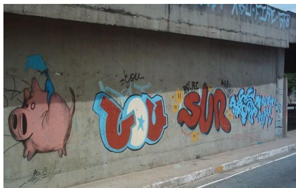
Bombs no viaduto da Lagoinha GOU e SUR - 2004