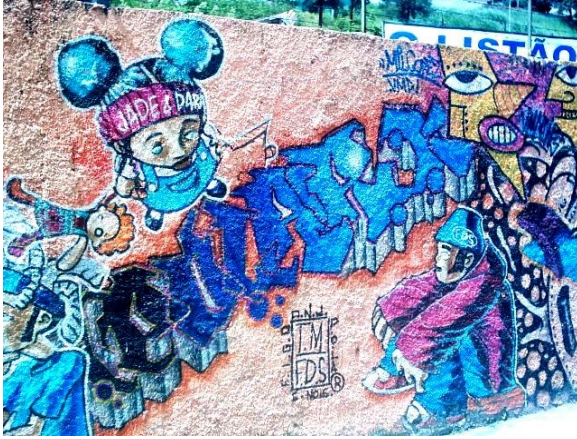
Figo, DNJ e Polar – Free Style Mural da Asmare – Barro Preto/BH