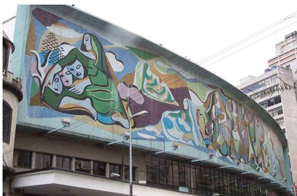
Teatro Cultura Artística Painel de Pastilhas Autor: Di Cavalcanti Consolação - São Paulo/SP ( www.graffiti.org.br )

No Brasil dos anos 50, vários murais ornamentavam as fachadas dos edifícios narrando temas da história e da arte brasileiras, como o realizado por Di Cavalcanti, com cerca de 15 metros de comprimento, na fachada do Teatro de Cultura Artística, na região central de São Paulo. Período rico da produção artística nacional, abafado com a chegada da década de 60, época em que ocorrem movimentos sociais organizados por estudantes universitários que reivindicavam melhorias no sistema educacional.