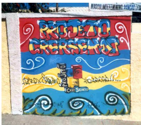
Fachada do Proj. Crersendo B. Betânia - 2002

Outros projetos como o Arena , também da PBH e o Crersendo , no bairro Betânia, vinculado a uma instituição religiosa, também procuram resgatar e incentivar o aprendizado e a conscientização dessa massa de garotos sedentos por espaço e reconhecimento.