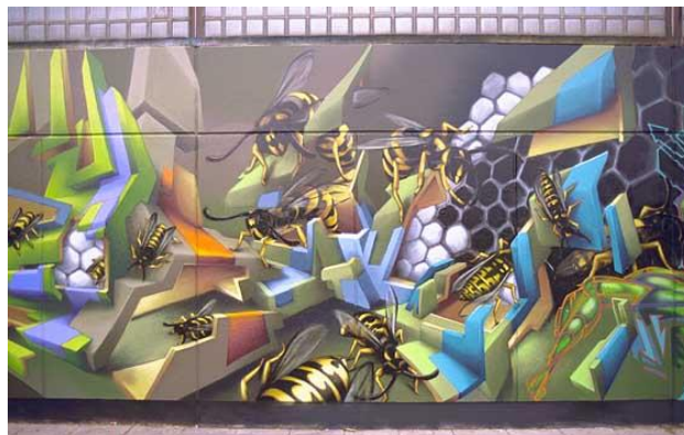
Graffiti em 3D - Daim ( www.graffiti-art.com/phonodrome/daim )

O acréscimo de símbolos, setas e espirais é a base do wild style 9 (estilo selvagem), um dos mais complexos tipos de de graffiti que surgiu durante a “guerra dos estilos” entre os autores. Dentre os muitos, faz-se necessário destacar RIFF 170.