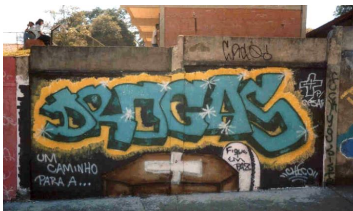
"Drogas" – Chico - Proj. Crersendo B. Betânia - 2002

Hoje, o número de jovens grafiteiros que atuam em Belo Horizonte vem aumentando com frequência, o que tem feito surgir novos nomes e talentos no cenário visual da cidade. Nomes como ANJO, DNINJA, ALAN, SERES, HYPER, OS DMENTES, DALATA, KARIOCA, REYONE, RAKAN E HISNE, dentre muitos outros. A experiência do graffiti tem alcançado os mais variados segmentos sociais e deixado seu rastro pelas ruas, muros e fachadas da moderna e jovem capital mineira.