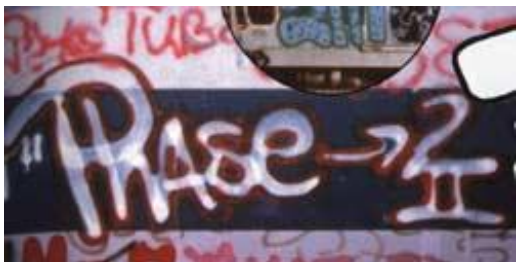
PHASE 2 – boollet - New York/1970 ( www.valladolidwebmusical.org/graffiti )

A letra boollet 7 (ou softie letter) foi elaborada por PHASE 2 e o estilo “3 D” 8 por PISTOL, dentre outros.