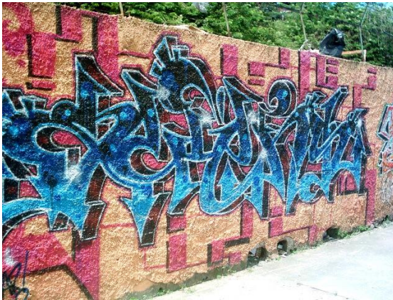
Os Dmentes – Wild Style Mural da Asmare – Barro Preto/BH