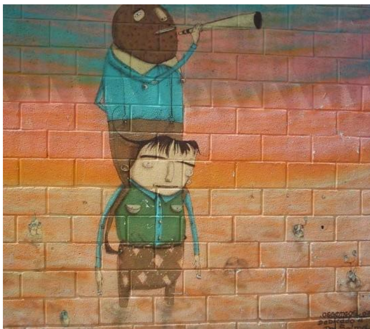
Os Gêmeos, 2003 - Mural da Asmare/BH