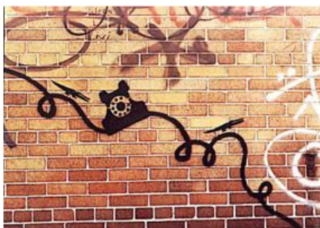
“Telefone”, de Vallauri

Alex Vallauri, em particular, recupera uma técnica antiga, a stencil art (ou molde vazado, impressão realizada a partir de uma máscara recortada), muito usada nos anos 30 pelos artistas da École de Paris . Sua produção chama a atenção da mídia e, em 1981, Vallauri participa da Bienal Internacional de São Paulo. Por volta de 1985, volta à Bienal com a famosa “Festa na Casa da Rainha do Frango Assado”.