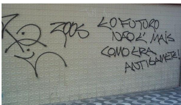
Pichação – B. Renascença

Pode-se afirmar que, embora entendidas como linguagens distintas, a pichação e o graffiti sempre andaram muito próximos, diria até se completando, uma vez que é muito comum a maioria dos grafiteiros de hoje terem sido ou serem pichadores. Uma das formas de se explicar essa relação é o fato da maioria desses jovens serem oriundos da periferia. Como um garoto deste contexto poderia comprar latas e mais latas de cores variadas para criarem seus trabalhos de graffiti? Uma inovação acrescentada pelos grafiteiros brasileiros no que se refere a essas dificuldades, foi apropriação da técnica do rolinho de pintura com tintas látex e pigmentos para fazer a base dos trabalhos, utilizando os sprays para os retoques finais e acabamentos. Mas, na maior parte dos casos, é muito mais fácil adquirir uma lata de spray e utilizá-la para “detonar” seu espaço ou deixar sua marca.