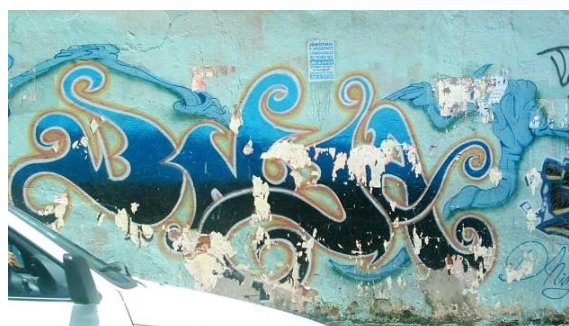
DNinja – 2004 – Lagoinha/BH