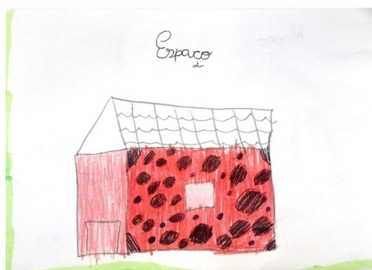
Figura 3 Representação da casinha

Fonte: Desenho elaborado por uma aluna (2018).