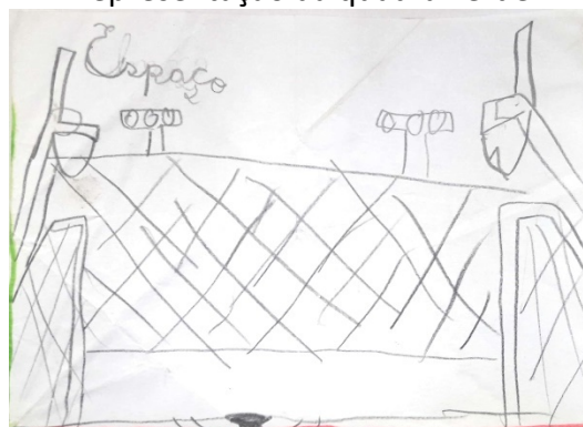
Figura 4 Representação da quadra verde

Fonte: Desenho elaborado por um aluno (2018).