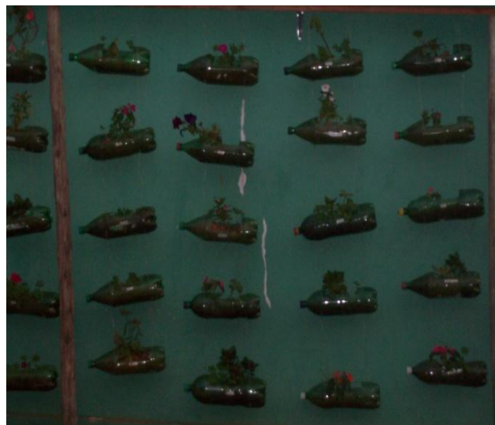
Jardim suspenso de Pet