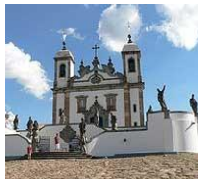
Foto da Basílica do Bom Jesus

Minas não é palavra montanhosa. É palavra abissal. Minas é dentro E fundo. As montanhas escondem o que é Minas. No alto mais celeste, subterrânea, É galeria vertical varando o ferro Para chegar ninguém sabe onde. Ninguém sabe Minas. A pedra O buriti A carranca O nevoeiro O raio Selam a verdade primeira, sepultada. Em eras geológicas de sonho Só mineiros sabem. E não dizem Nem a si mesmos o irrelatável segredo Chamado Minas Carlos Drummond de Andrade