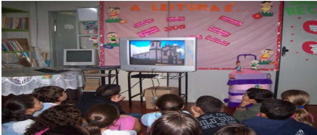
Foto da igreja de Nossa Senhora