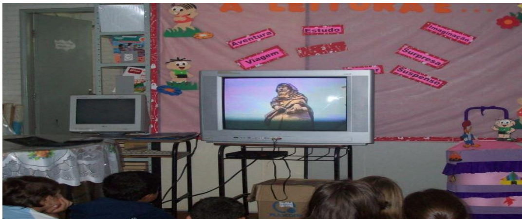
Foto de um dos profetas