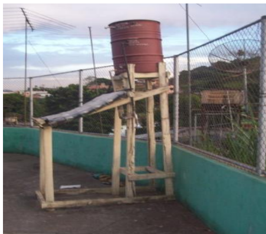
Projeto Aquecedor Solar