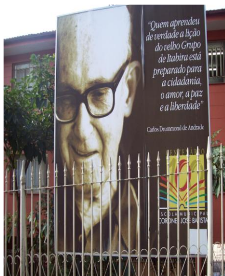
Fachada do grupo escolar de CDA

Com a poesia, debates, seminários, fotografias foram importantes instrumentos para reforçar, ampliar e promover esses sentimentos entre os alunos do quinto ano em relação à cidade de Congonhas. A caminhada ainda é longa, mas com a Educação Ambiental poderemos mudar o destino de nossa cidade, pois assim, nossos patrimônios nunca serão fotografias na parede.