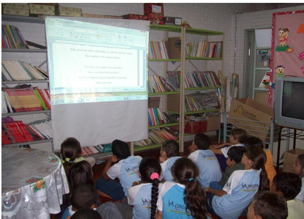
As fotos mostram os alunos lendo poesias de Drummond com interesse.