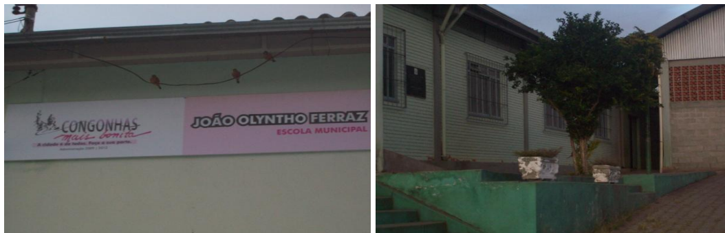
As fotos acima representam a fachada da E.M “João Olyntho Ferraz”

A partir deste triste cenário, é que se iniciou na Escola Municipal “João Olyntho Ferraz” uma pesquisa sobre a mineração e seus impactos na cidade.