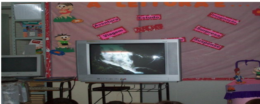
Foto da Cachoeira