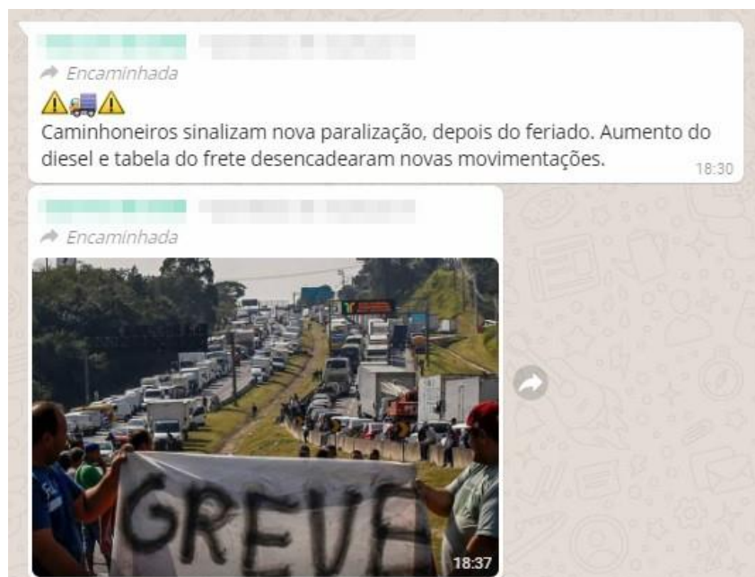
Figura 7 Print de uma fake news enviada por Whatsapp .