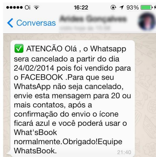
Figura 6: Print de uma fake news enviada por Whatsapp .

Posteriormente, como forma de introduzir as estratégias de leitura de uma fake news , mostramos dois exemplos de mensagens de Whatsapp que contêm informações falsas (ver Figuras 6 e 7). De acordo com Marcuschi (2009, p. 15), os gêneros emergentes nas novas tecnologias “são relativamente variados, mas a maioria deles tem similares em outros ambientes, tanto na oralidade como na escrita”. Nesse sentido, as mensagens expostas aproximam-se das notícias na medida em que relatam um fato de interesse público. Contudo, dentre outros fatores que a diferenciam da notícia tradicional, é possível destacar que sua autoria não é institucional, pois não são vinculadas a um veículo jornalístico. Incentivamos, então, que os alunos expressassem suas opiniões sobre os textos, se pareciam falsos ou não e por quais motivos. Além disso, perguntamos se eles recebiam esse tipo de mensagem e em quais contextos isso acontecia.