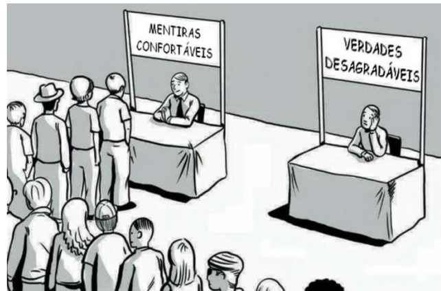
Figura 2: Tirinha sobre mentiras e verdades.