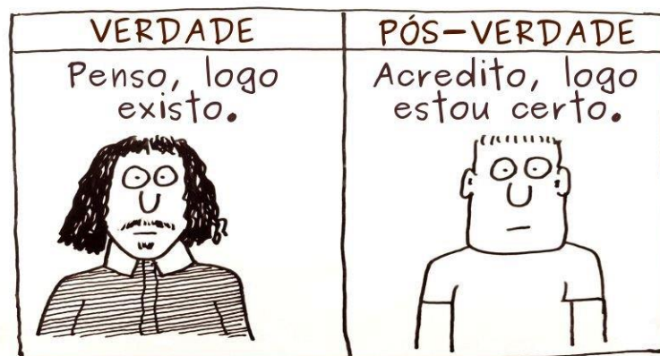
Figura 3: Tirinha sobre verdade e pós-verdade.