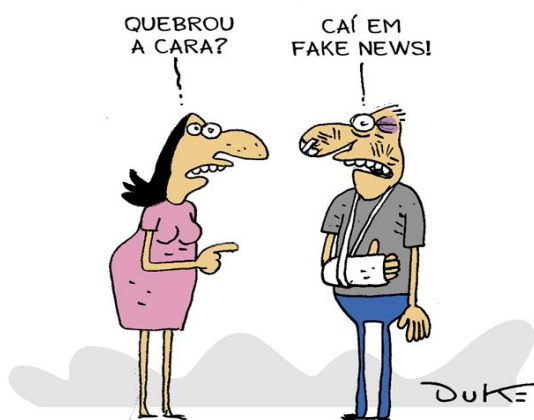
Figura 1: Tirinha sobre fake news .

Ainda como forma de propor uma reflexão crítica a partir da exposição a textos multimodais e introduzir o conceito de Pós-verdade para os alunos, foram lidas e discutidas algumas tirinhas (ver Figuras 1-5). Na análise das tirinhas, foram considerados os detalhes das imagens em conjunto com as formas verbais. Além disso, foi relevante observar o uso da ironia em algumas delas para compreender seu sentido, visto que os alunos demonstraram certa dificuldade na interpretação desse aspecto.