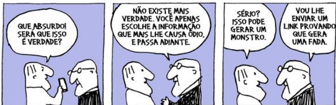
Figura 4: Tirinha que questiona a noção de verdade.