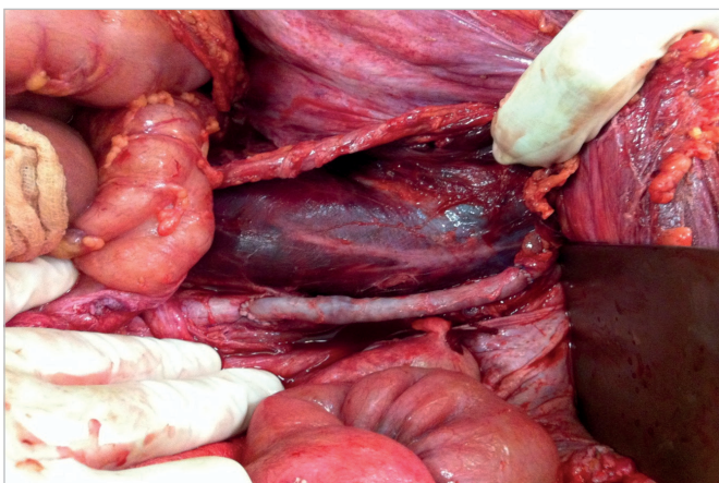
Figura 2. Reconstrução de artéria íliaca externa esquerda utilizando veia safena magna, por meio de anastomose látero-terminal com artéria íliaca externa esquerda e término-terminal com artéria íliaca comum.