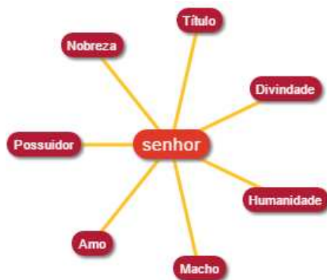
FIGURA 1 – Rede semântica da palavra senhor