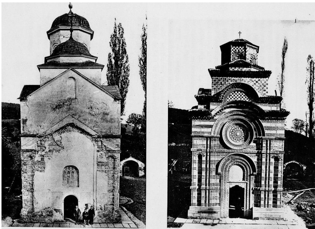
Figura 2. Recuperação da Igreja de Kalic.