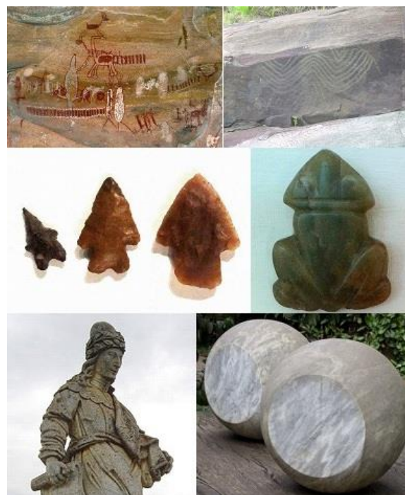
Figura 5. (a, b, c, d, e, f) – Arte em pedra brasileira

catarinenses (SC), a indústria lítica da tradição Umbu do sul do país (RS), os muiraquitãs amazônicos (AM), os profetas de Congonhas ou as obras em mármore de Waldemar Cordeiro em Inhotim (MG) (Figura 5 - a, b, c, d, e, f).