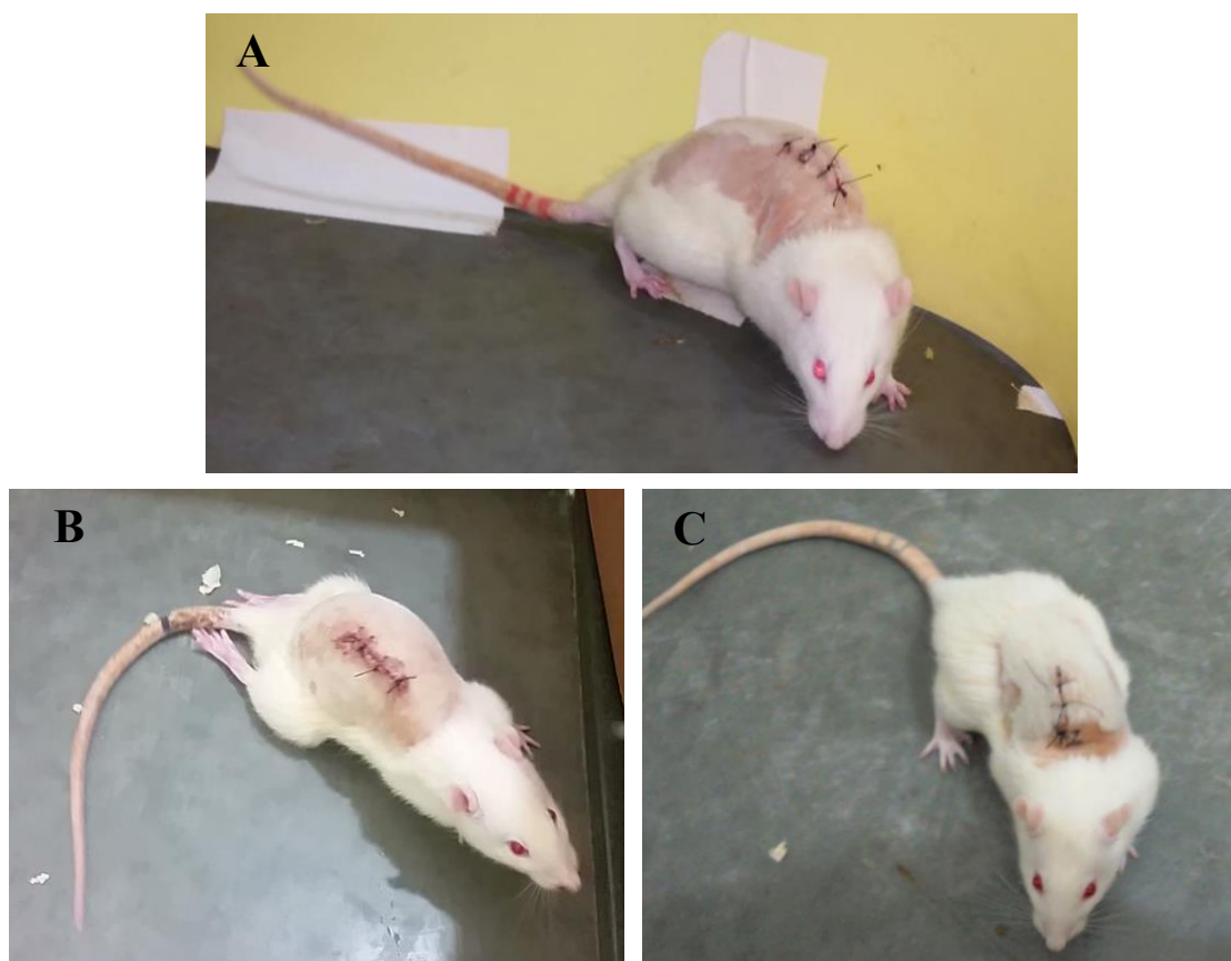
Figura 3. Avaliação da função locomotora em campo aberto ao sétimo dia pela escala de BBB em ratos Wistar . A) Animal do grupo CN, classificado no escore 21: observa-se sustentação de peso nos membros torácicos e pélvicos, com estabilidade do tronco e cauda elevada. B) Animal do grupo CP, classificado no escore 0 a 1: nenhum movimento observável a movimento discreto de uma a duas articulações do membro pélvico. C) Animal do grupo CTM-MO, classificado no escore 20: observa-se sustentação de peso nos membros torácicos e pélvicos, com instabilidade do tronco, e cauda elevada (esta última não observável na imagem).

células possuem a capacidade de atingir o local da injúria, dispensando a cirurgia para aplicação intralésional; assim, evita-se uma nova exposição e lesão na medula espinhal (Osaka et al. , 2010; Han et al. , 2015; Ohta et al. , 2017).