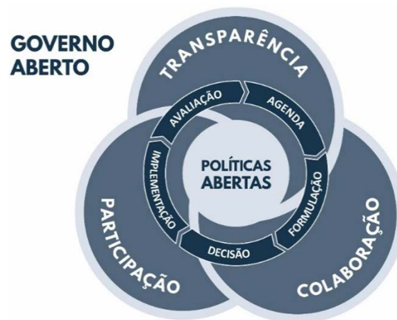
Figura 1. Ciclo de políticas públicas abertas.

Rodrigues, 2017). Segundo Howlett, Ramesh e Perl (2013), a análise de políticas públicas inclui, necessariamente, considerar os atores do Estado e da sociedade envolvidos nesses processos de tomada de decisão e sua capacidade de influenciar e agir. Para Araújo e Rodrigues (2017), o objetivo não é explicar o funcionamento do sistema político, mas a lógica da ação pública, as continuidades e interrupções nas políticas públicas, as regras do seu funcionamento ou o papel e os modos de interação de atores e instituições nos processos políticos.