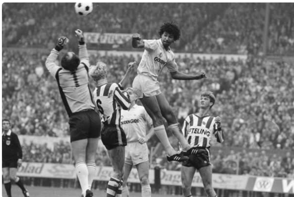
Gullit jogando pelo Feyenoord em 1983.

campo em solidariedade ao companheiro Marenga [17] – vítima de racismo e que sozinho decidiu abandonar a partida e ir para os vestiários. O que não aconteceu, já que o jogo prosseguiu.