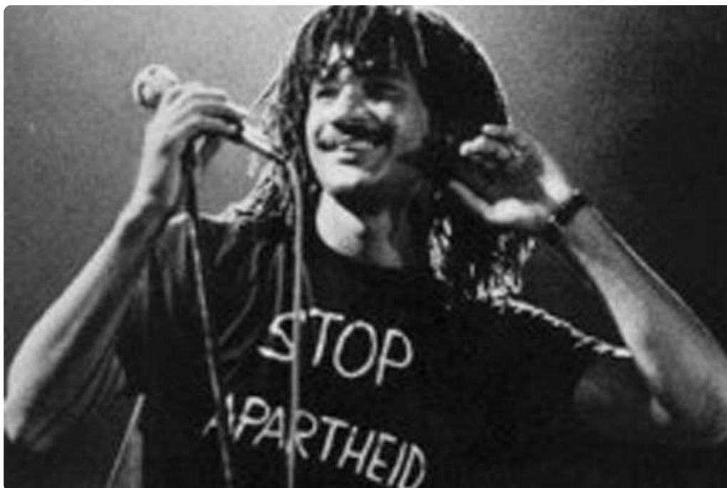
Gullit em show antiapartheid.

A apresentação citada acima foi mais uma ação do Tulipa Negra – forma como era chamado pelos torcedores – que caminhava para consolidar-se além de grande atleta, um ativista anti-apartheid e antirracista. Demonstrando que um jogador de alto nível pode conciliar sua trajetória esportiva com militância política, sem que uma ultrapasse os limites da outra e sim em uma relação conjunta, dual e dialética, como na vida de maneira geral.