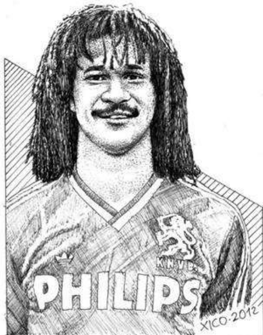
Essa ilustração faz parte da Série Grandes jogadores que não ganharam uma Copa do Mundo

contribuiu para que essas vozes fossem ouvidas. Conseguiu ao longo de sua trajetória lutar contra o racismo e ser um dos gênios do futebol mundial.