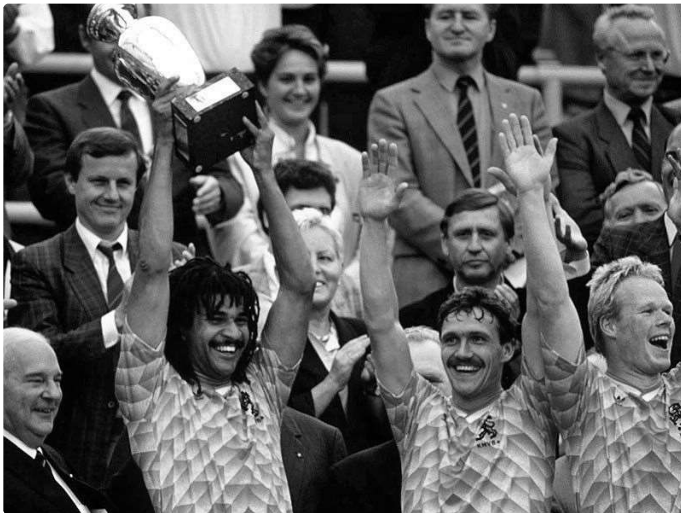
Gullit ergue o troféu da Euro 88.

No início de carreira na Holanda, Gullit usava o cabelo dread que para nós negros já se configura em ato de afirmação identitária e para a sociedade talvez um ato de “rebeldia”. Seus cabelos dreadlocks foram destacados em uma música dedicada a ele em 1987, mesmo ano em que foi bola de ouro: “Capitão Dread” [8] da banda holandesa Revelention Time. Em tradução livre a música tem trechos como “Capitão dread elegante em total controle / Ele corre como um raio / É o primeiro capitão negro da seleção”.