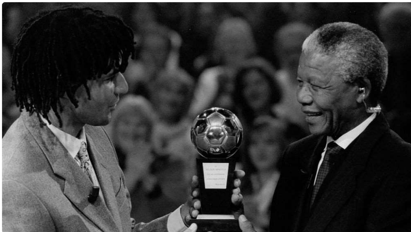
Gullit entrega bola de ouro para Mandela.

Atualmente alguns atletas aderem a determinados movimentos coletivos surgidos na sociedade no combate ao racismo, como por exemplo na National Basketball Association-NBA onde jogadores como LeBron James, Dwyane Wade e outros que aderiram ao movimento “Black Lives Matter” (Vidas Negras Importam), inclusive realizando protestos antes das partidas, redes sociais e até não entrarem em quadra para realizar partidas (boicote).[11] Talvez o futebol necessite de um movimento similar que aglutine as vozes e sair do aspecto individual desta luta. Trazer o debate de forma permanente e coletiva, como ações antirracistas inclusive organizadas pela FIFA em outras oportunidades, acrescentando outros temas como machismo e homofobia, pois, o futebol figura entre as maiores audiências (televisivas em relação aos esportes) do mundo.[12]