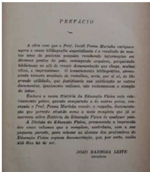
Figura 2. Prefácio História da Educação Física e dos Desportos no Brasil

En la Figura 3 –Dedicatoria História da Educação Física e dos Desportos no Brasil – se puede observar que Inezil Penna Marinho optó por hacer un homenaje y se la dedicó al Sr. Gustavo Capanema 26 , exministro de Educación y Salud.