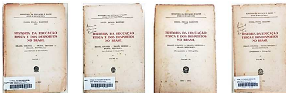
Figura 1. História da Educação Física e dos Desportos no Brasil Portadas de los volúmenes I, II, III e IV

El libro está organizado teniendo los marcos históricos de la política brasileña como delimitadores de los volúmenes y de sus partes. La división escogida: la Independencia de Brasil; la Proclamación de la República; la Revolución de 1930; el Golpe de Estado de 1937; el Golpe de 1945; la posesión del Presidente electo en 1946 15 .