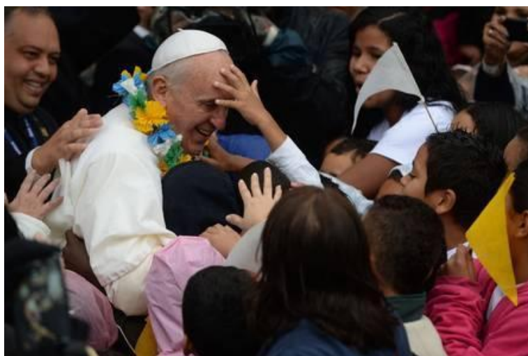
Figura 2 - Papa abraça as crianças em visita à Favela da Varginha, em Mangueiras, na zona norte do Rio de Janeiro.

Desde sua eleição, a popularidade de Francisco só aumentou. Uma pesquisa realizada pela Global Language Monitor (GLM) 34 aponta que o Papa Francisco foi a pessoa de quem mais se falou na internet em 2013. A revista Rolling Stone , conhecida por suas matérias sobre celebridades do mundo pop e por pautar outros veículos de comunicação, trouxe em fevereiro de 2014, uma matéria de capa 35 traçando o perfil do Papa Francisco com o título: “Papa Francisco – Os tempos estão mudando” 36 . Nesse mesmo ano, a revista Time 37 destacou o novo pontífice como personalidade do ano. Além destas, outras publicações exaltaram o novo Papa como “o homem do ano” 38 .