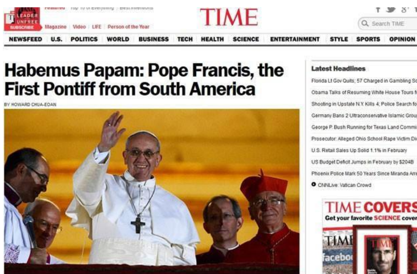
Figura 4 - Página inicial do portal da revista britânica Time

Legenda do portal G1 - O site da revista britânica "Time" destaca o ineditismo da nacionalidade argentina do Papa Francisco I