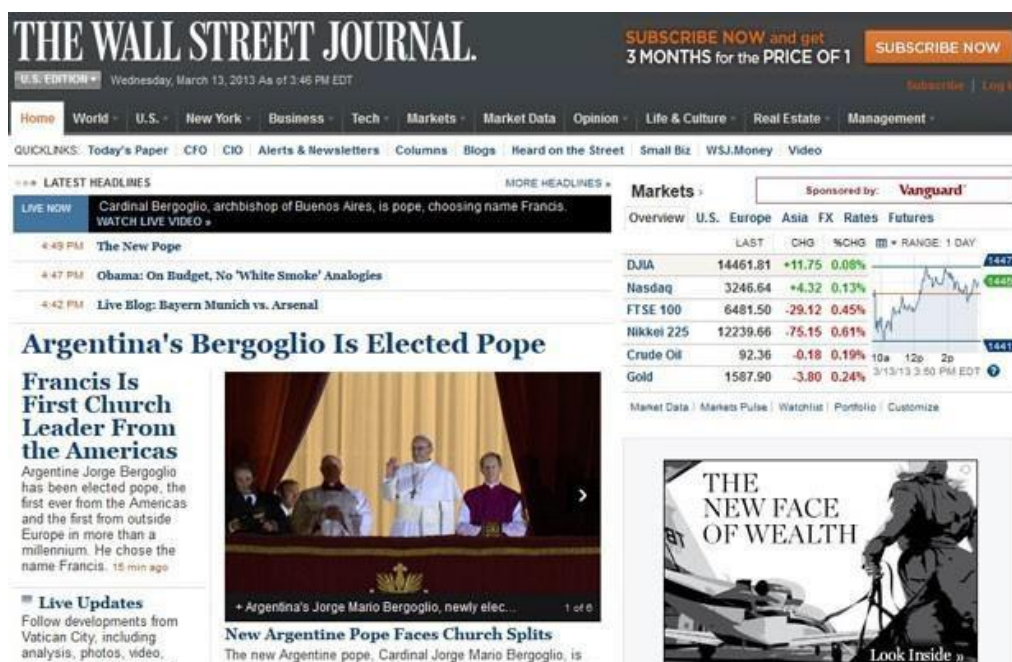
Figura 11 - Página inicial do jornal americano Wall Street Journal

Legenda do portal G1 – Jornal italiano "Corriere della Sera" destaca primeiro Para de fora da Europa