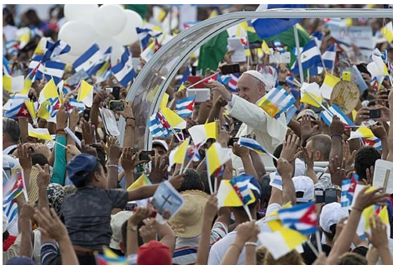
Figura 1 - Papa Francisco chega à Praça da Revolução, em Havana, Cuba.

O que observamos em muitas imagens que circulam na mídia quando o Papa viaja a outros países é a figura de Francisco em contato com o povo que se mobiliza para vê-lo. Dois exemplos que ilustram isso são a foto de uma das matérias publicadas no site G1, quando o Papa esteve em Cuba: “Papa Francisco chega à Praça da Revolução em Cuba para missa” 32 ; e uma foto publicada no site do Jornal Extra, na matéria “JMJ: Em visita à Favela da Varginha, Papa Francisco usou até colar de havaiana” 33 .