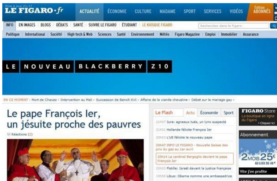
Figura 6 - Página inicial do jornal francês Le Figaro

Legenda do portal G1 - Versão digital do francês "Le Figaro" grifou a atuação em defesa dos pobres do jesuíta eleito Papa