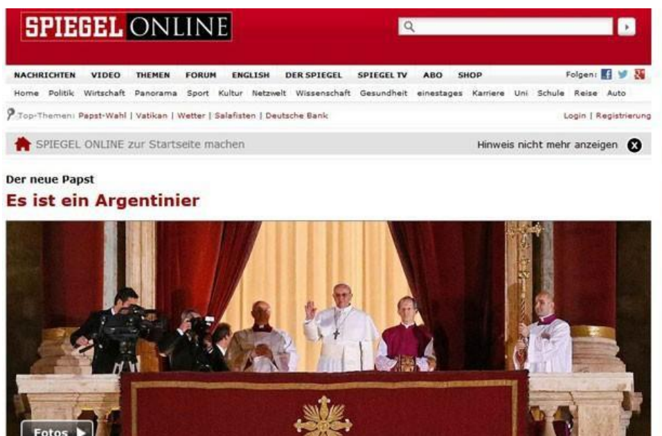
Figura 7 - Página inicial do site alemão Spiegel online

Legenda do portal G1 - Versão digital do francês "Le Figaro" grifou a atuação em defesa dos pobres do jesuíta eleito Papa