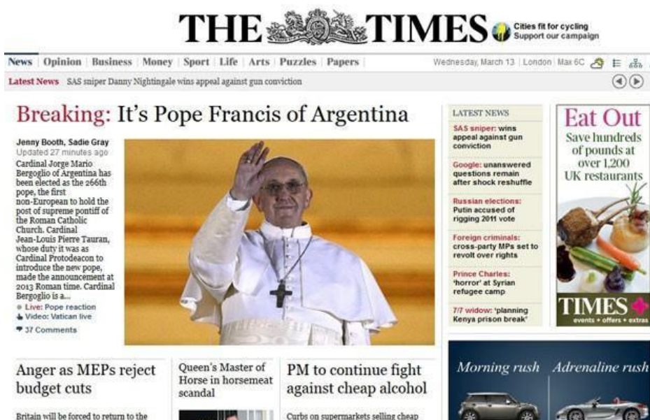
Figura 5 – Página inicial do jornal inglês The Times

Legenda do portal G1 - O site da revista britânica "Time" destaca o ineditismo da nacionalidade argentina do Papa Francisco I