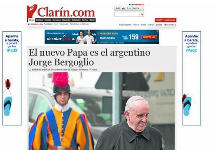
Figura 13 - Página inicial do jornal argentino Clarín

Legenda do portal G1 – Argentino 'Olé' compara a eleição de argentino a gol de Maradona em Copa do Mundo