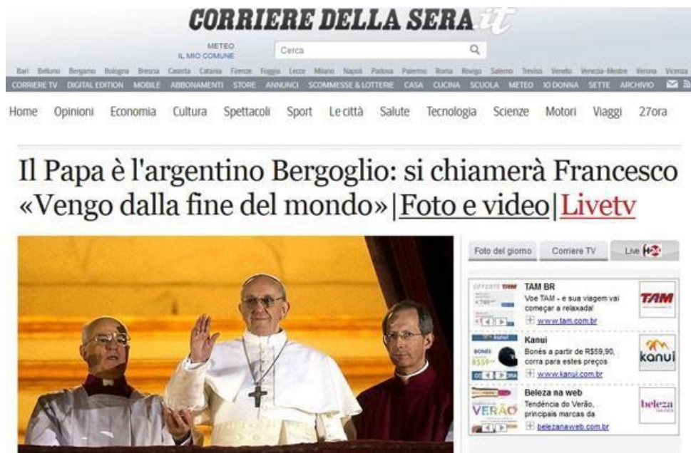
Figura 10 - Página inicial do jornal italiano Corriere della Sera

Legenda do portal G1 – Jornal italiano "Corriere della Sera" destaca primeiro Para de fora da Europa