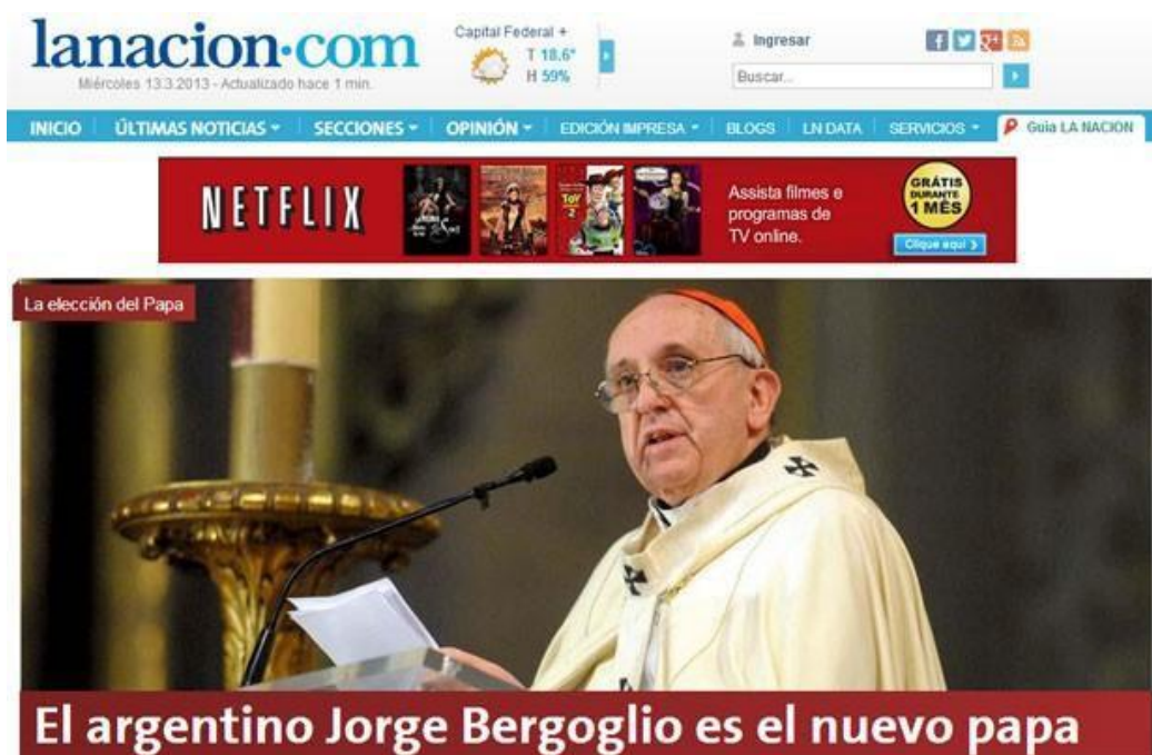
Figura 14 - Página inicial do jornal argentino La Nación

Legenda do portal G1 – Site do jornal argentino 'La Nacion' estampa que 'Argentino Jorge Bergoglio é o novo Papa'