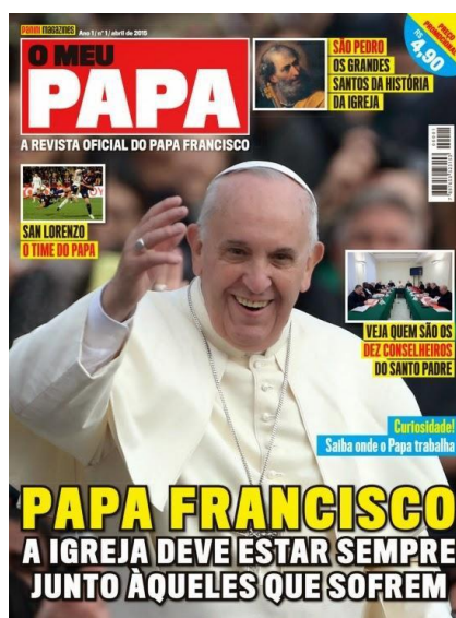
Figura 3 – Capa da 1ª edição da Revista “O Meu Papa” lançada no Brasil em abril de 2015

Ao completar quatro anos de pontificado, em 2016, pesquisas revelaram que a popularidade de Francisco permaneceu alta, como mostram as notícias: “Pesquisa