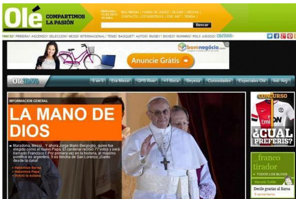
Figura 12 - Página inicial do jornal argentino Olé

Legenda do portal G1 – Argentino 'Olé' compara a eleição de argentino a gol de Maradona em Copa do Mundo