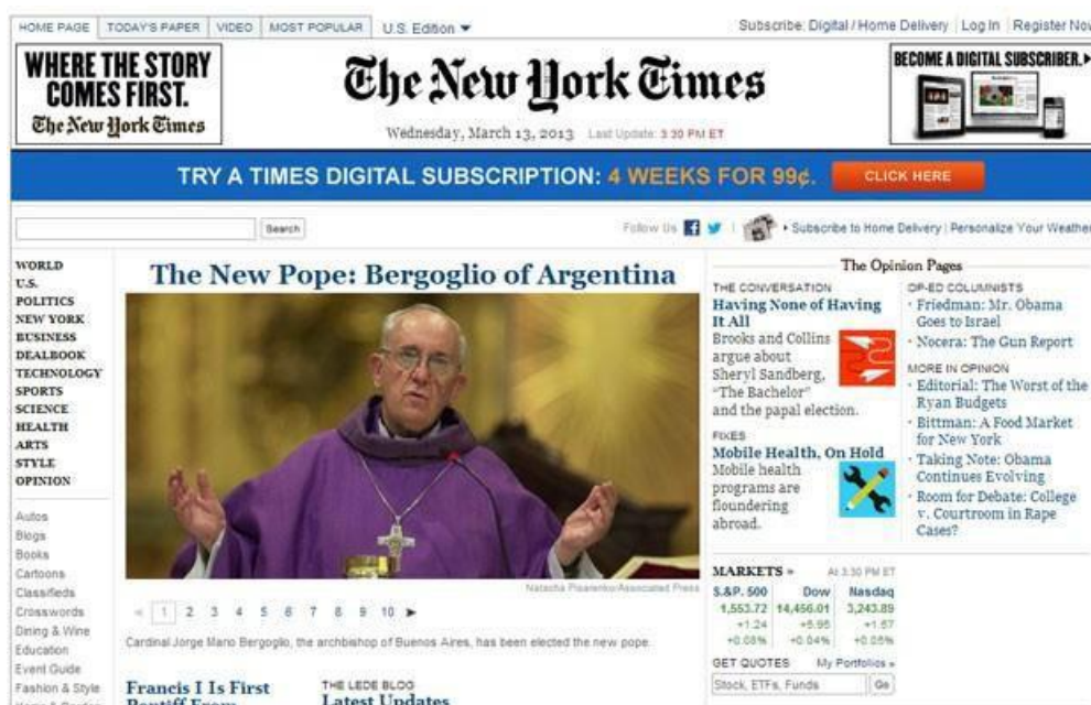
Figura 15 - Página inicial do jornal americano The New York Times

Legenda do portal G1 – Site do jornal argentino 'La Nacion' estampa que 'Argentino Jorge Bergoglio é o novo Papa'