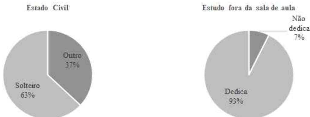
Figura 3 - Estado civil e estudo fora da sala de aula

No tocante à predominância do estado civil dos discentes que compuseram a amostra, 63 % informaram estarem solteiros, enquanto 37 % declararam outro estado civil. Outra característica descritiva da amostra evidenciou que 93 % dos estudantes se dedicaram aos estudos, excetuando as horas em aula, em pelo menos uma hora por semana, enquanto 7 % informaram não se dedicarem. A Figura 3 apresenta estes resultados.