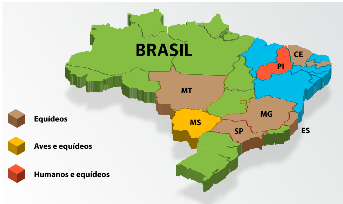
Figura 1: Estados brasileiros onde a presença de FNO foi reportada, por sorologia ou RT-PCR, em aves, equídeos e/ou humanos. Região Centro-Oeste (MT- Mato Grosso; MS- Mato Grosso do Sul); Região Sudeste (ES – Espírito Santo; Minas Gerais – MG; SP- São Paulo); Região Nordeste (CE – Ceará; PB – Paraíba; PI – Piauí)