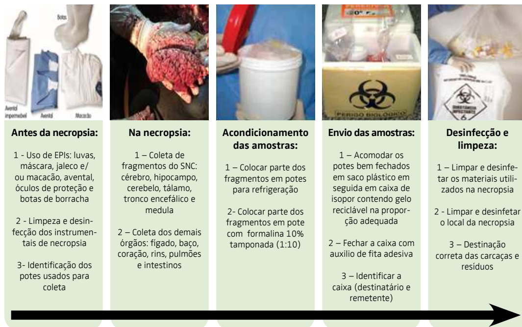
Figura 3: Passo a passo das etapas de coleta, acomodação e envio das amostras para o laboratório e procedimento após a necropsia.