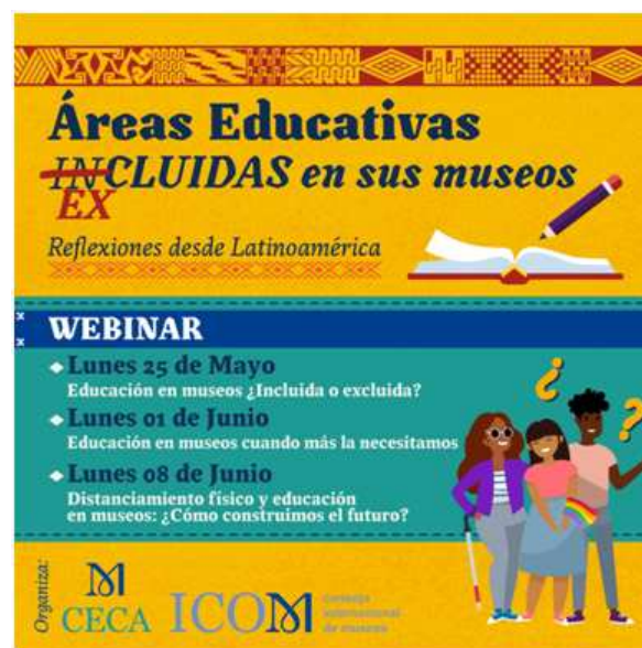
Figura 1 – Cartão de divulgação online dos webinários promovidos pelo CECA-LAC, em maio e junho de 2020.

Do mesmo modo, o CECA-LAC tem promovido encontros e eventos online, com a participação de profissionais de toda a América Latina e Caribe, como a série de webinários Áreas Educativas (in) excluídas em seus museus - Reflexões desde a América Latina, que reuniu educadores para conversas sobre temas pertinentes ao contexto da Pandemia de Covid-19, quando as restrições sociais e profissionais estavam apenas em seu início.