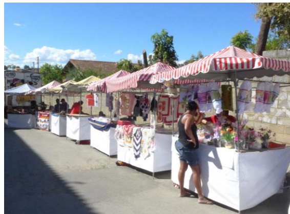
Figura 3: Feira Saia da Linha

A Feira Saia da Linha originou-se a partir do coletivo Saia da Linha, que buscava fazer com que a população, do município de Vespasiano ou não, tivesse acesso às atividades socioeducativas e bens culturais fora da área central do município, em um processo de descentralização da valorização dessa produção cultural. O nome “saia da linha” faz referência à Linha Verde 7 , via expressa que interliga o centro do município de Belo Horizonte ao Aeroporto Internacional Tancredo Neves (Confins/MG) e margeia os bairros Maria José e Santa Clara, locais onde a feira atua. A parceria mostrou-se muito