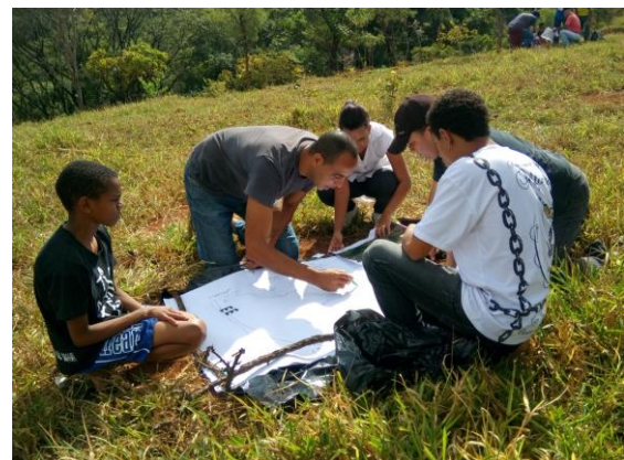
Figura 5: Parque Barroco

A parceria entre a disciplina e o Parque Barroco, assim como o Projeto CASULO, também teve continuidade no segundo semestre de 2016. A proposta do Parque nasce da identificação por parte dos integrantes da própria comunidade da notável fragilidade do município de Matozinhos na disponibilidade de espaços públicos e de áreas verdes para a população da região. Ele seria, portanto, um polo de lazer, cultura e educação, agregando os demais municípios metropolitanos. O processo de planejamento coletivo adotado nos demais projetos foi também estruturador no caso do Parque do Barroco, sendo uma de suas ações a organização de uma caminhada pelo parque