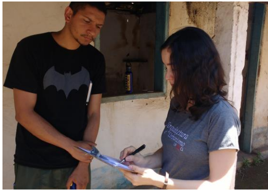
Figura 6: Vila Vicentina

consolidação do parque. Outra ação foi o mutirão de plantio de cerca de 200 mudas de plantas pela própria população, aliado a outras atividades culturais .