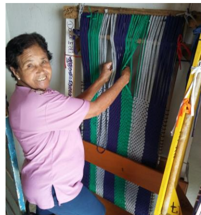
DESENVOLVIMENTO, CRISE E RESISTÊNCIA: QUAIS OS CAMINHOS DC Figura 1: Associação Santa Martinha

A Associação Santa Martinha é um espaço, localizado no município de Ribeirão das Neves, que oferece oficinas e materiais para que pessoas majoritariamente com idade superior aos 60 anos possam desenvolver trabalhos artesanais no tear. A partir de um valor mínimo para o custeio dos materiais, são oferecidos ainda aos inscritos café da manhã e almoço, tornando-se também um local de encontro e lazer. Durante o desenvolvimento desse projeto,