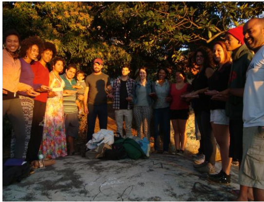
Figura 4: Projeto CASULO (antiga Incubadora Criativa)

de Tudo, organizada na Escola de Arquitetura da UFMG, expandindo o contato dos parceiros com outros produtores artesanais da RMBH.