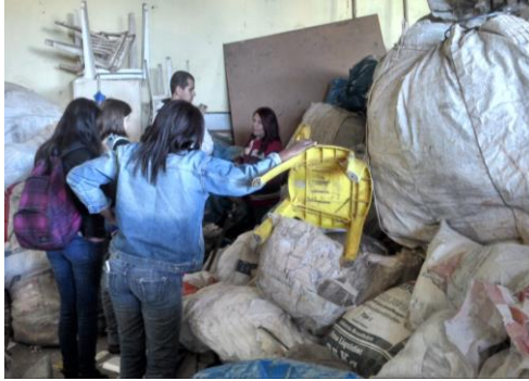
Figura 2: COOPERVESP

os alunos junto aos parceiros buscaram otimizar os trabalhos realizados na Associação, a partir do uso de retalhos de algodão descartados por uma fábrica de vestuário. Além disso, também foi estabelecido o contato entre algumas feiras da RMBH e as tecelãs - incluindo a Feira Saia da Linha, também agregada como um projeto da disciplina - de modo a criar um vínculo intermunicipal entre os grupos, além de expandir as possibilidades de produção e venda.