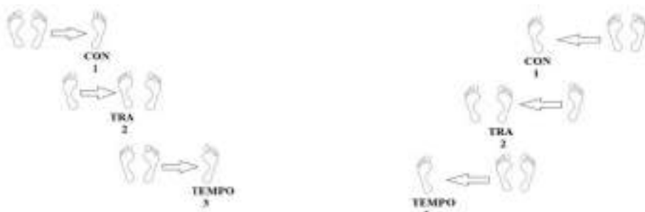
Marcação da base – “dois pra lá, dois pra cá”

No mesmo ritmo e com a mesma sequência de marcação, fizemos o “pra frente e pra trás”, mudando apenas o sentido da movimentação. Realizamos sempre os deslocamentos primeiramente sem música, depois inserindo-a para treinar o movimento e o ritmo.