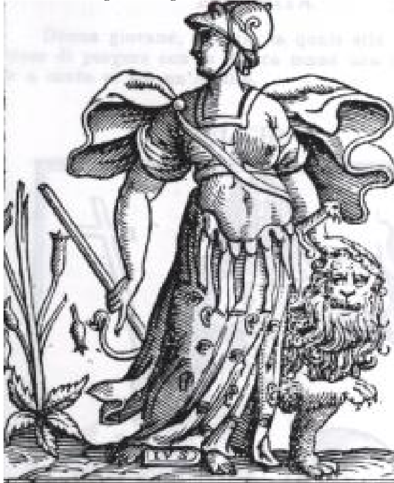
Figura 5 – Alegoria da Razão de Estado.

Fonte - RIPA, Cesare, Iconologia . 1593, p. 376.