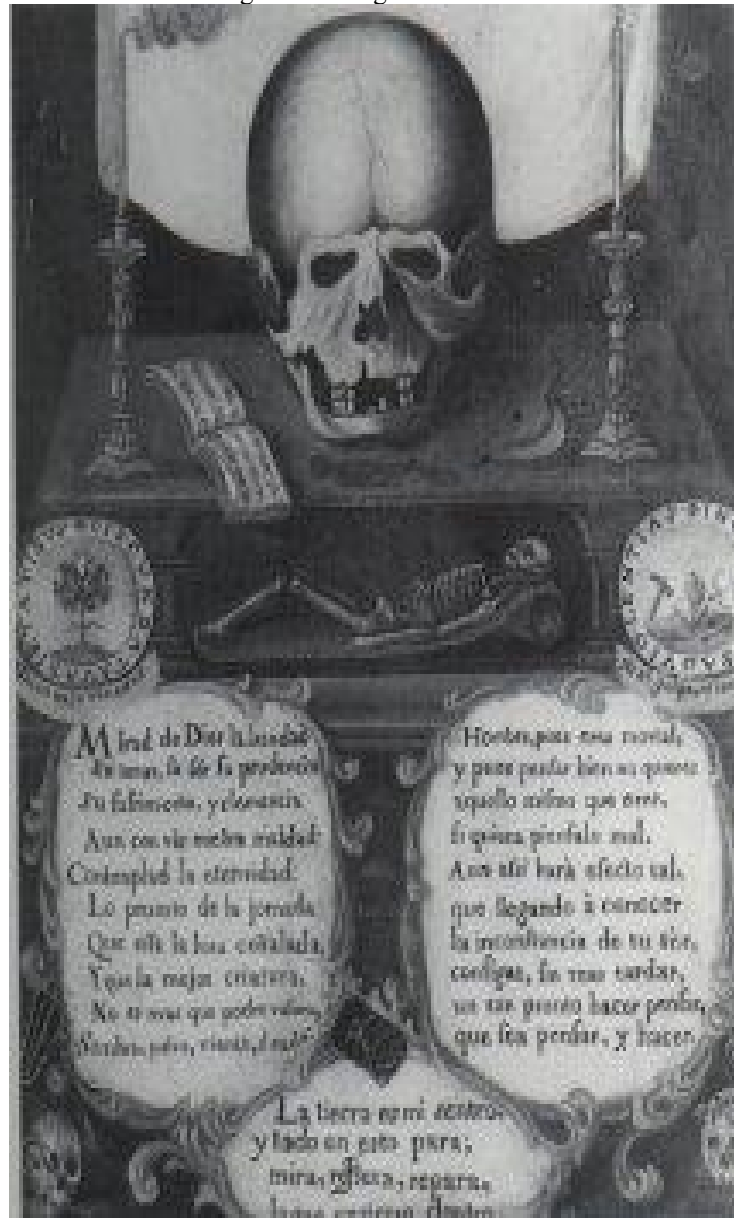
Figura 4 – Alegoria da Morte.