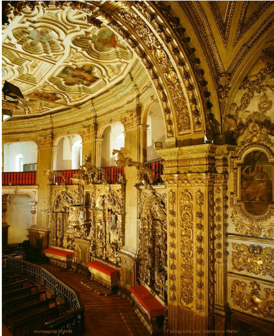
Figura 7 – Matriz de Nossa Senhora do Pilar – Ouro Preto – Minas Gerais.