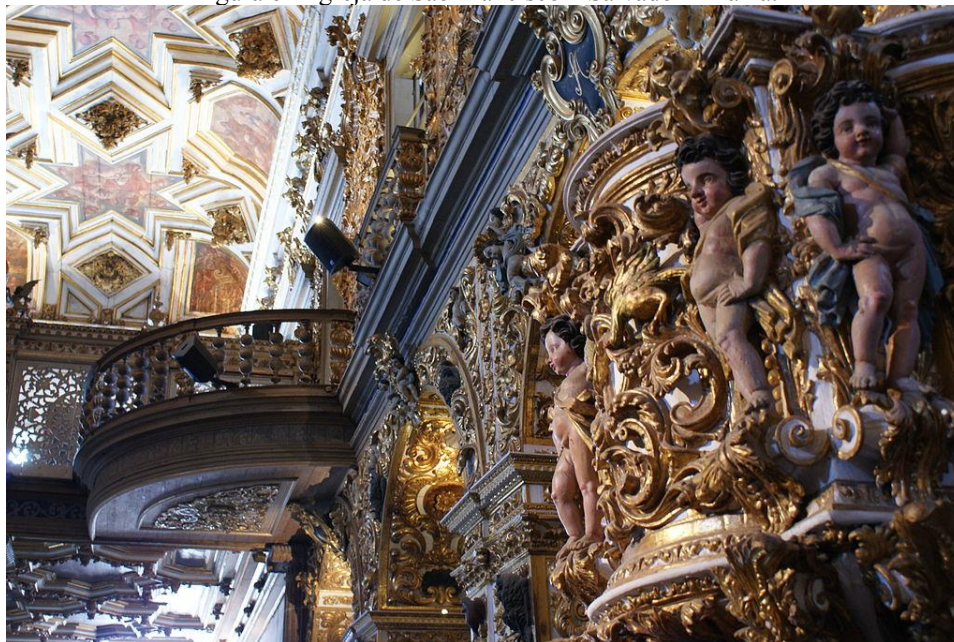
Figura 6 – Igreja de São Francisco – Salvador – Bahia.

Analisado como arte da decifração, o universo simbólico desse tempo lança mão de diversas categorias que vão desde a cosmologia até os reinos terrestres, passando pelas alegorias morais e comportamentais humanas, até as institucionais referentes ao Estado ou à Igreja. Os recursos alegóricos reforçam o caráter propagandístico da monarquia católica, já que há a consciência da função decisiva das imagens, 'idiotarum libri' – livros dos ignorantes –, numa propaganda voltada as massas compostas predominantemente de iletrados 12 , submetendo-as à moldura da ordem social vigente 13 . As representações se apropriam de convenções alegóricas culturalmente regradas e codificadas 14 , ou seja, da repetição contínua dos mesmos significantes para os mesmos significados e, concomitantemente, tornam-se herméticas, distanciando a figura representada de seu sentido imediato, necessitando que a agudeza possibilite a aproximação e fusão dos conceitos e conseqüente entendimento da representação 15 . (Figura 6).