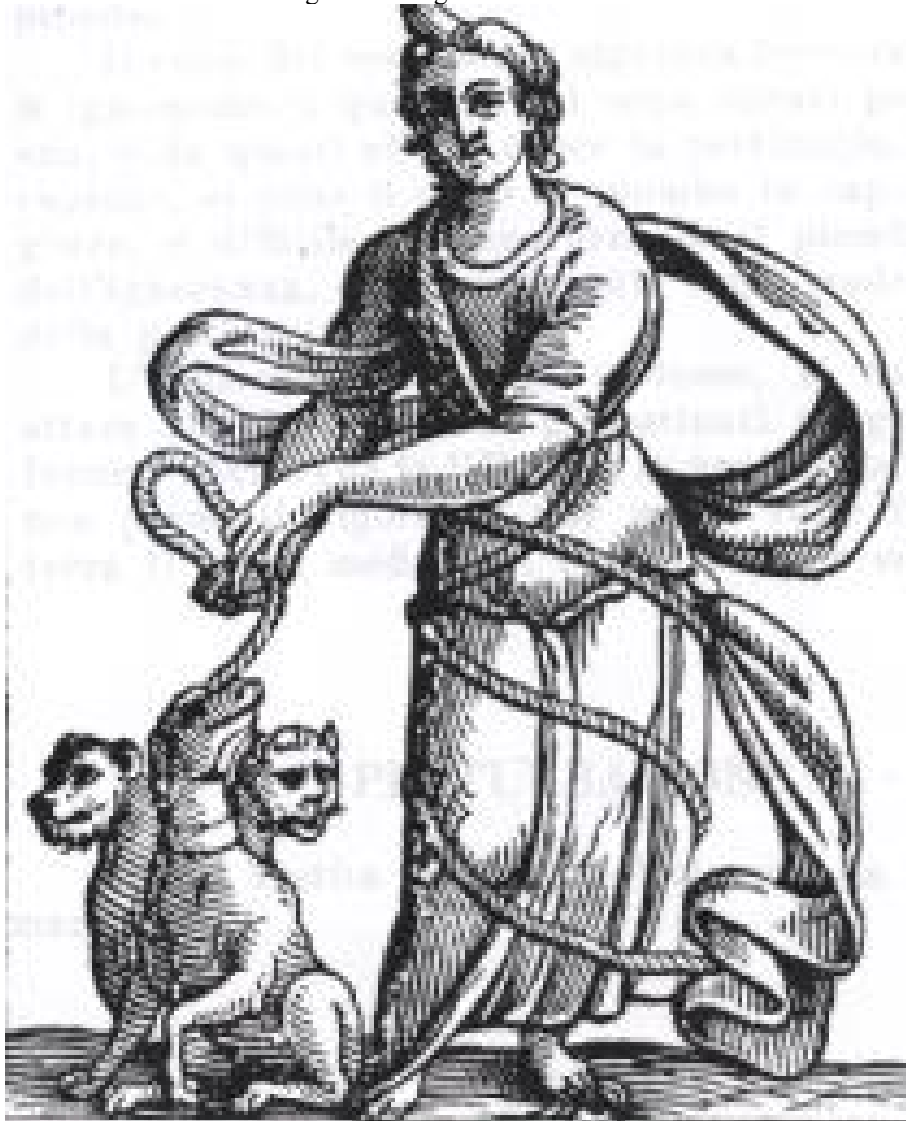
Figura 1 - Alegoria da Persuasão.

Fonte - RIPA, Cesare, Iconologia . 1593, p. 188.