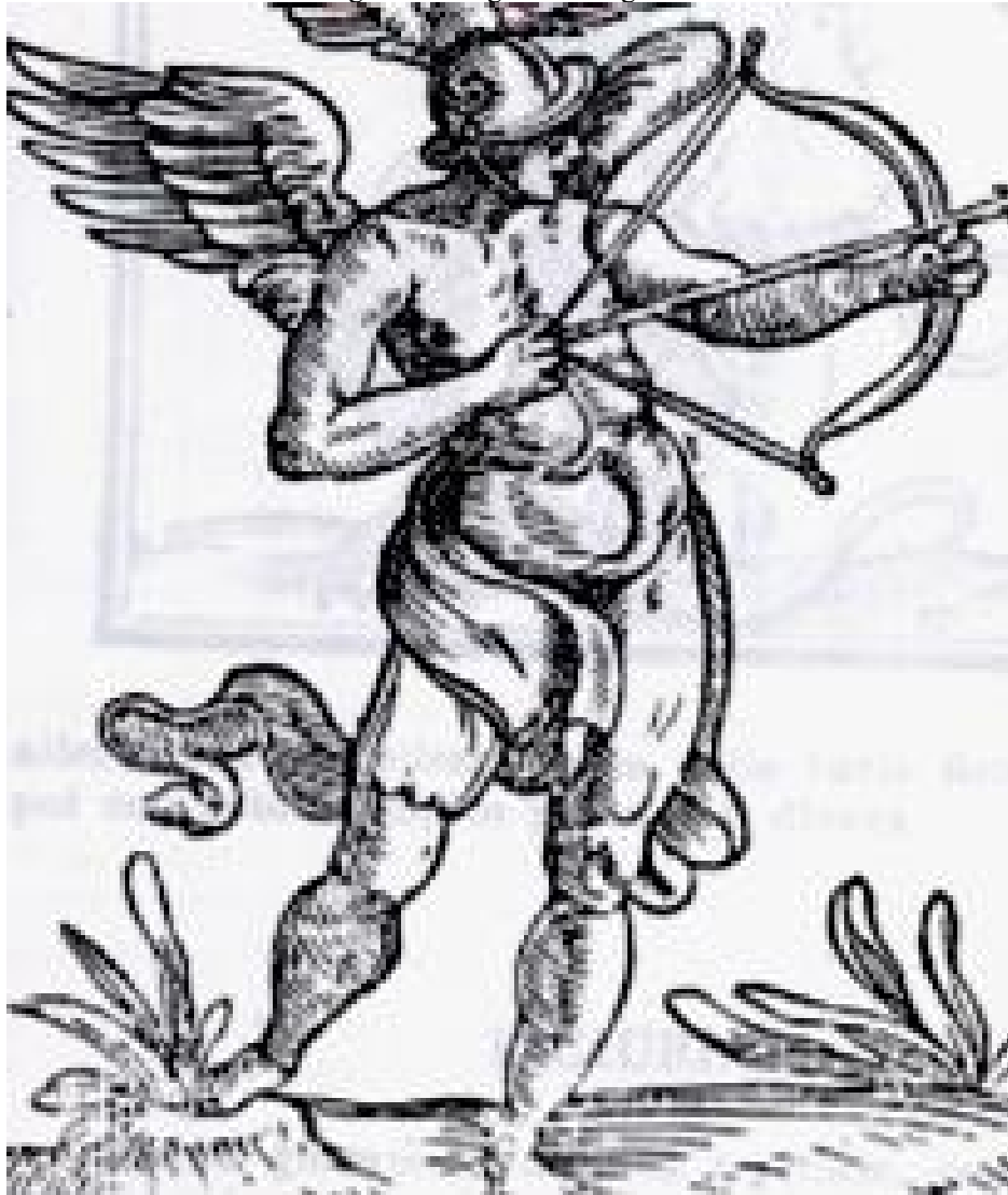
Figura 2 - Alegoria do Engenho.

Fonte - RIPA, Cesare, Iconologia . 1593, p. 188.