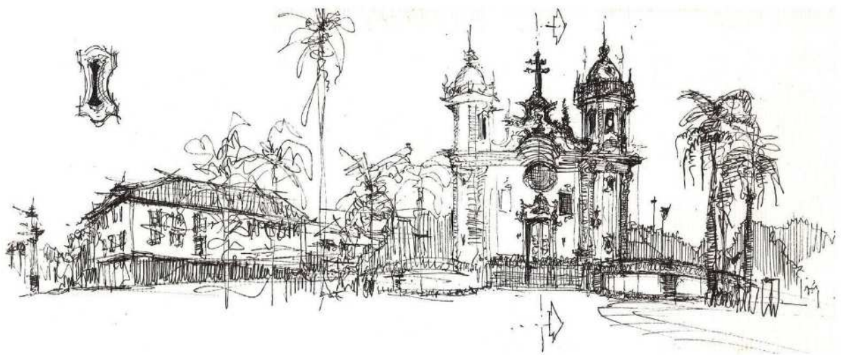
Figura 6 Estudo da fachada da Igreja de São Francisco de Assis, São João del-Rei, Minas Gerais, 1774. Projeto de Antônio Francisco Lisboa (o Aleijadinho, 1730-1814). Bico de pena sobre papel

páveis, debuxáveis, mas que estão expressas pelas formas. Quatremère está, mais uma vez, fazendo a defesa da utilização do tipo: