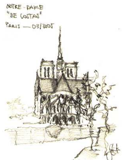
Figura 3 A Catedral de Notre Dame, Paris, um dos monumentos mais estudados pelos neogóticos. Lápis sobre papel Desenho: Jota Clewton, 2005

Na década de 1830, o movimento neogótico ganhava corpo e na França já eram muitas as novas igrejas construídas com a sua conhecida padronagem ogival