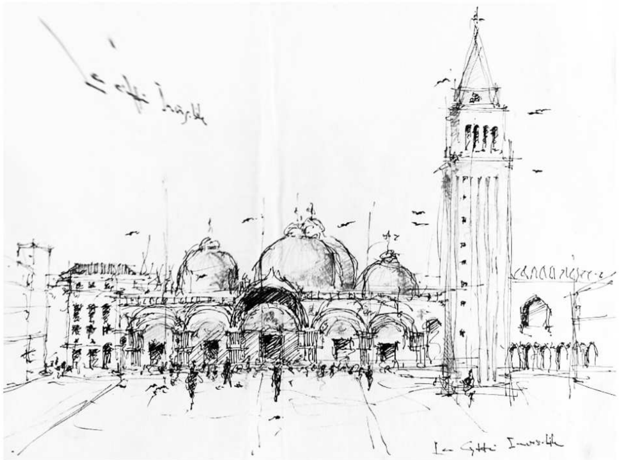
Figura 2 Basilica de San Marco, Veneza, uma das obras mais emblemáticas da arquitetura bizantina. Bico de pena sobre papel Desenho: André Lissonger, s.d.

No entanto, a sua predileção – e da Academia – pela arte clássica não se colocou sem contestações: nos anos próximos à publicação de seu Dicionário Histórico de Arquitetura (1832), o neoclassicismo por ele defendido já vinha sendo questionado como único padrão arquitetônico válido, e talvez até por isso mesmo ele tenha recompilado seus verbetes para a Enciclopédia de Charles-Joseph Panckoucke, publicada em fascículos de 1788 a 1825, e da qual nosso personagem ficou responsável pela seção de arquitetura. A reedição condensada em dicionário de arquitetura era, além de tudo, uma forma de reafirmar os valores por ele entendidos como universais para construções e obras de arte. No entanto, já desde meados do século anterior, as restaurações de obras medievais fizeram florescer um movimento de revalorização da arquitetura gótica, que passaria a rivalizar com o neoclassicismo vigente.