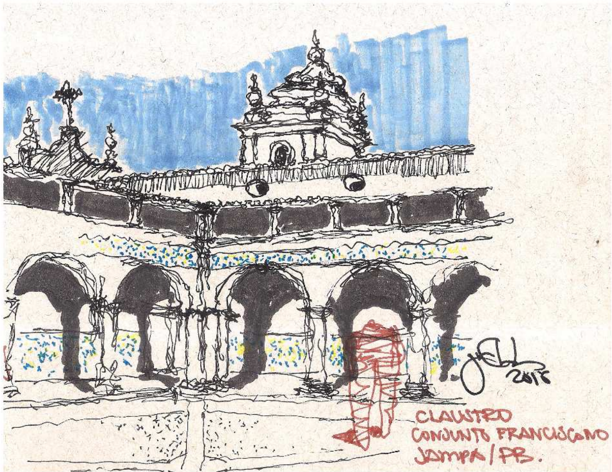
Figura 9 Claustro do Conjunto Franciscano de João Pessoa, Paraíba, que, como anterior, apesar de barroco, tem seu claustro com arcos e colunas na mesma linguagem clássica. Bico de pena e marcadores sobre papel Desenho: Jota Clewton, 2015

muitas obras maneiristas e até barrocas da arquitetura colonial brasileira, caso dos claustros franciscanos registrados por Jota Clewton aqui.