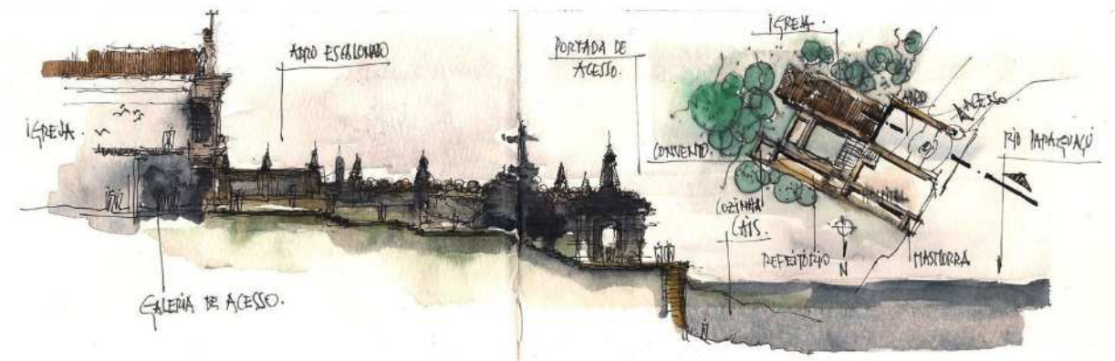
Figura 5 Estudo da implantação do Convento de São Francisco do Paraguassú, Cachoeira, Bahia. Bico de pena e aquarela sobre papel Desenho: André Lissonger, 2016