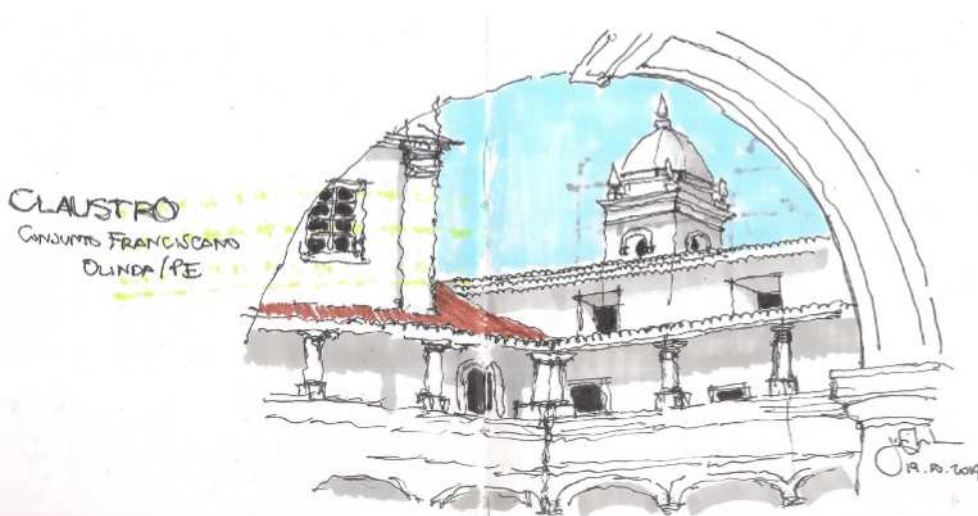
Figura 8 Claustro do Conjunto Franciscano de Olinda, Pernambuco, que, apesar de barroco, tem seu claustro com arcos e colunas de linguagem clássica. Bico de pena e marcadores sobre papel

Ainda, neste verbete o autor recorre ao termo “língua”, pois Quincy está tentando demonstrar a necessidade de compreensão de todo um sistema organizacional que gera as formas e lhes dá sentido, por isso essa noção de vocabulário. A linguagem que Quincy considerava a mais perfeita era, obviamente, a clássica, tanto para a arquitetura como para as outras artes. É interessante notar que, mesmo em obras de períodos que ele defenestrava, cético que era das obras do século XVII, “demasiadamente inventivas” para o autor, encontramos a imitação bastante austera e comedida de princípios compositivos das ordens clássicas, como