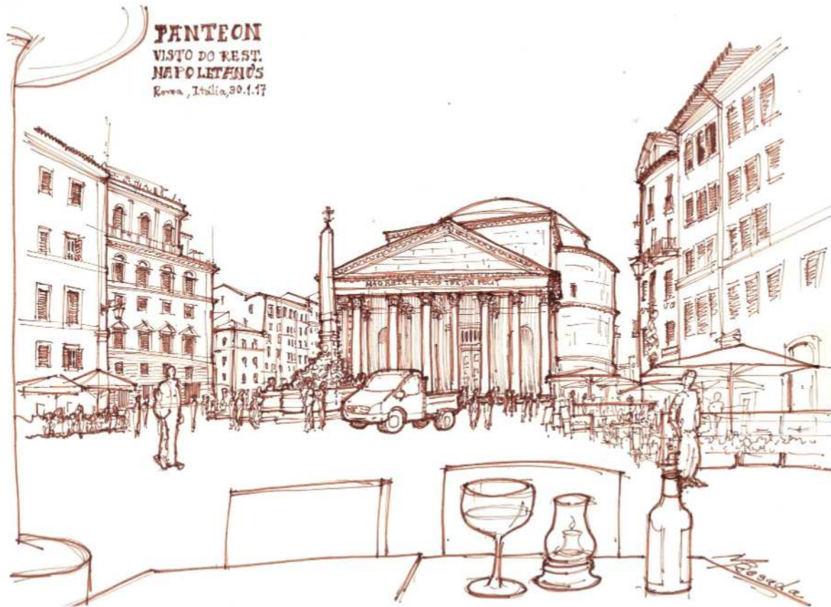
Figura 1 Panteon, Roma, uma das obras da antiguidade clássica com a qual Quatremère de Quincy teve contato. Bico de pena sobre papel Desenho: Mateus Rosada, 2018