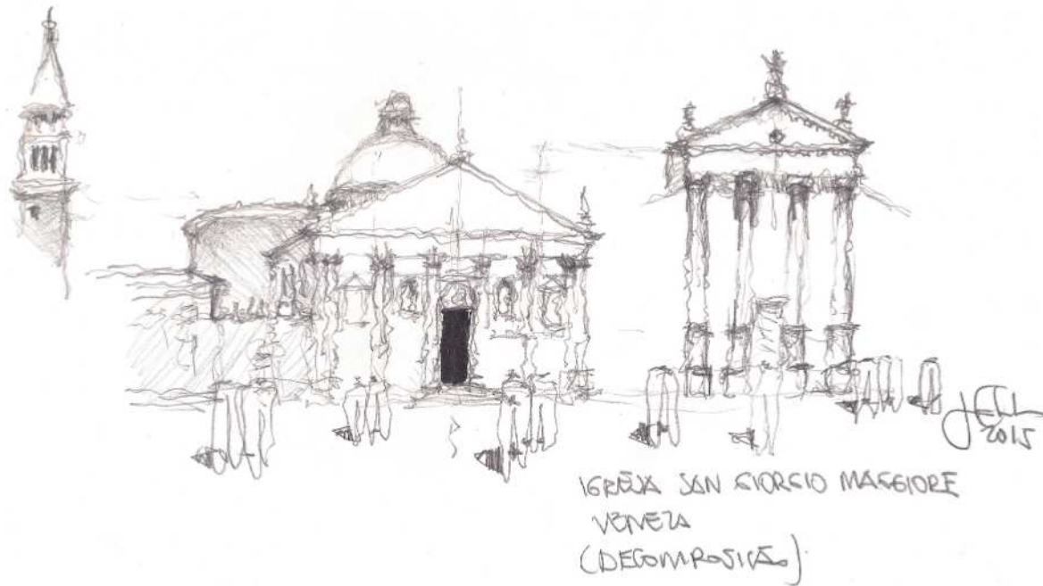
Figura 12 Estudo da fachada da Igreja de San Giorgio Maggiore, Veneza, Itália, 1566. A fachada do templo, projeto de Andrea Palladio (1508-1580), compõe-se de duas fachadas, com colunas e frontão, sobrepostas. Lápis sobre papel