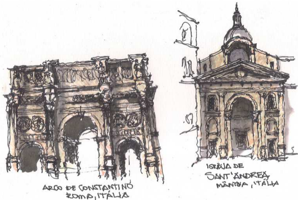
Figura 11 Arco de Constantino, Roma, Itália, 315 d.C. | Igreja de Sant'Andrea, Mântua, Itália, 1460, projeto de Leon Battista Alberti (1404-1472). Bico de pena e marcadores sobre papel

Nosso amigo volta a bater na tecla de que há limites a serem respeitados pela arquitetura, e que a possibilidade de invenção não dá ao arquiteto carta branca para criar sem que se submeta a algum sistema de regras. Provavelmente Quatremère de Quincy está tentando argumentar contra o historicismo arquitetônico que começava a ganhar viço e corpo naqueles idos anos 1830. Em mais da metade deste último verbete ele se coloca na defensiva, recobrando necessidade de um regramento - a invenção, em qualquer gênero não existe sem regras; que as regras, longe de contrariar o gênio, favorecem-no e secundam-no, preservando-o dos desvios do capricho - , no entanto, por estar tratando de um tema muito conceitual e que não é fisicamente palpável, o autor não consegue estabelecer um limite claro de até onde vai a invenção saudável, correta, e onde começa o devaneio, a invenção sem critério. É muito provável que visse em obras de arquitetos renascentistas e, especialmente em alguns maneiristas, a capacidade de atingir o limite que a invenção permitiria estando ainda subordinada aos padrões da natureza, ao máximo possível dentro do sistema das ordens clássicas, como em obras de Leon Battista Alberti (1404-1472) e Andrea Palladio (1508-1580).