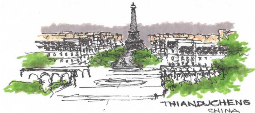
Figura 7 Tianducheng, China, a cópia chinesa de Paris. Bico de pena e marcadores sobre papel Desenho: Jota Clewton, 2020