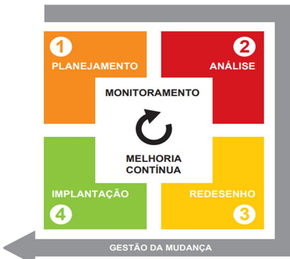
Figura 1- Ciclo de gestão de processos

Fonte: Coletânea de Inovação e Modernização na Gestão Pública Volume 2 - Guia para gestão de processos 9