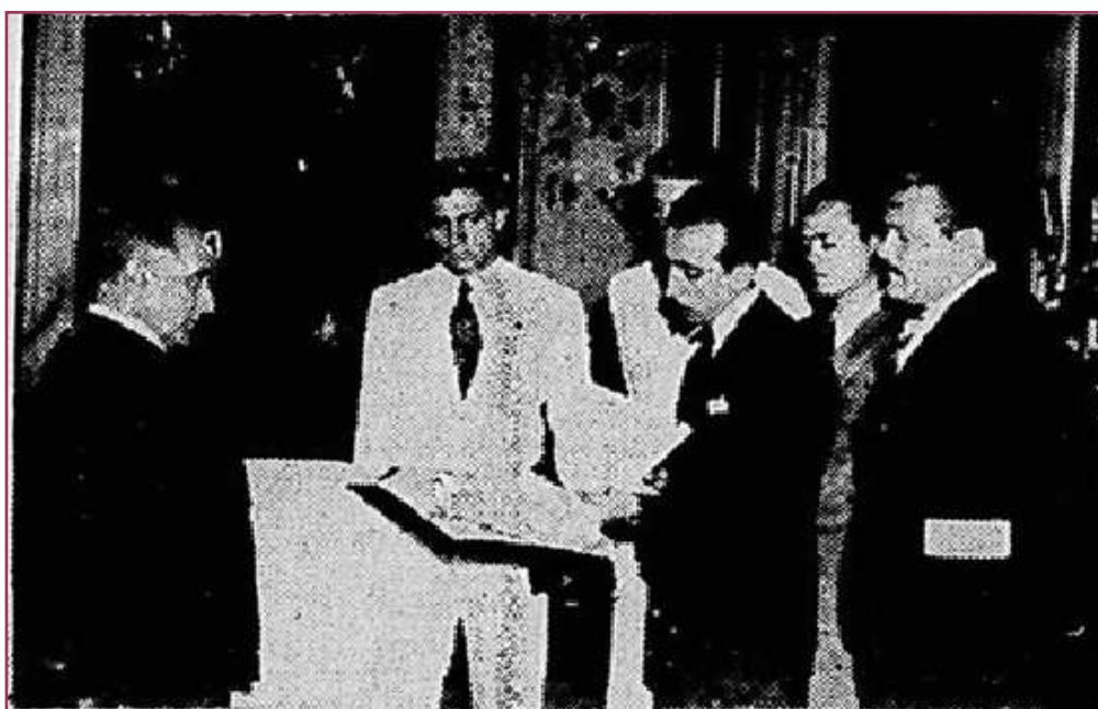
Figura 1 – Entrega de título de presidente honorário da CUBE a Getúlio Vargas.