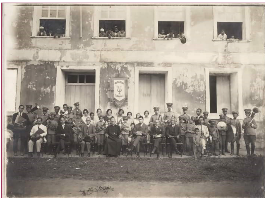
Figura 3 - Corporação Lira Municipal de Claudio (sem data).

Além da inauguração dos bilhares e do cinema, quatro clubes sociais e um clube esportivo entraram em funcionamento nessa mesma época: Elite Clube Literário e Recreativo Claudiense, Clube Recreativo Claudiense, Sociedade União Claudiense, Sociedade Cruzeiro do Sul e Independência Foot-Ball Club. Sabemos ainda que duas corporações musicais participavam das festividades promovidas por esses clubes: a Banda Musical Claudiense e a Banda Santa Cecília (GAZETA DE MINAS, 10 set. 1911, p. 1; 5 nov. 1911, p. 2; 25 fev. 1912, p. 2; 10 mar. 1912, p. 2). Antes disso, em 1894, temos já notícia da Euterpe Claudiense, além da Corporação Lira Municipal de Claudio (Figura 3). Todas essas bandas atuavam em bailes e eventos sociais diversos, em festas religiosas, em jogos de futebol, em comemorações de datas cívicas e eventualmente em espetáculos de circos e outras companhias artísticas.