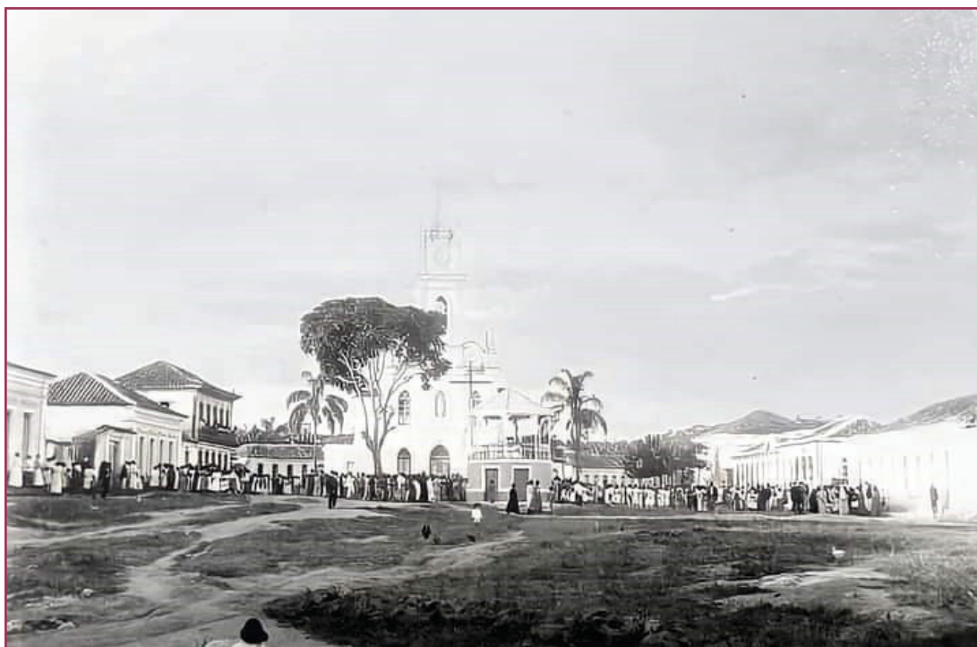
Figura 1 - Largo da Matriz de Cláudio (sem data)

entreposto para o comércio dedicado ao atendimento dos povoados que compunham o distrito (GAZETA DE OLIVEIRA, 8 mar. 1888, p. 1).