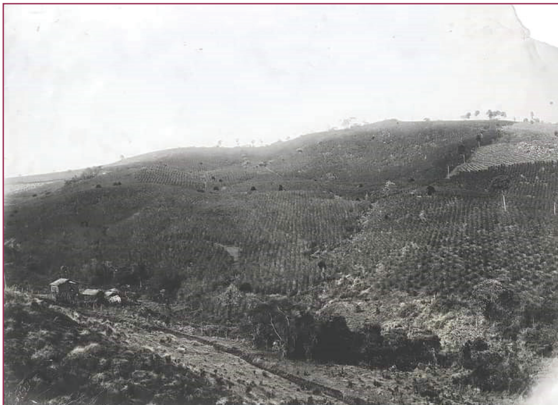
Figura 2 - Cafezal do fazendeiro Olintho Diniz, distrito de Carmo da Mata (sem data).