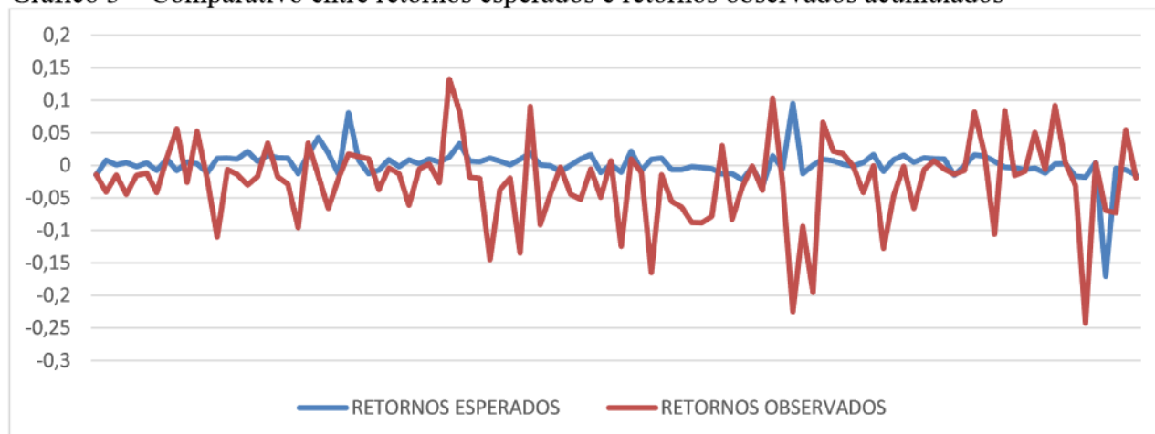
Gráfico 3 – Comparativo entre retornos esperados e retornos observados acumulados

A Tabela 5 mostra os retornos médios esperados com base na regressão estimada pela equação (3), se mostrando menores que os retornos anormais e sempre positivos durante a janela de estimação.