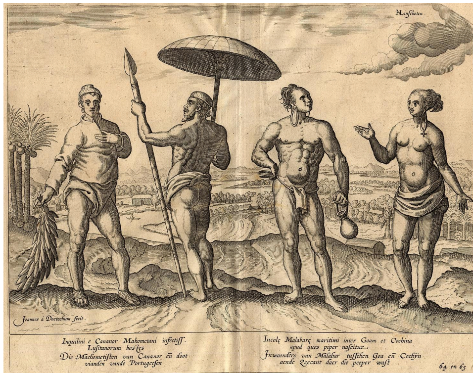
Figura 2: "Maometanos de Cananor, inimigos mortais dos portugueses", Histoire de la Navigation de Jean Hughes de Linschot aux Indes Orientales , 1638 (Zvab, s.d.). Esta representação de muçulmanos da cidade na costa sudoeste da Índia é uma dentre as várias contidas numa coleção de livros, que além de conhecimento, proporcionavam publicidade e propaganda das navegações portuguesas para outros europeus por volta do século 17.