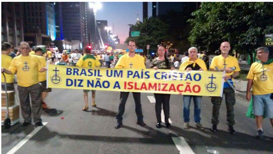
Figura 5: Durante manifestação em 2016 pelo impeachment da então presidente brasileira Dilma Rousseff, membros da Liga Cristã Mundial (LCM) seguram um cartaz posicionando-se contra a “islamização do Brasil”. A foto era a capa do grupo de Facebook “BRASIL DIZ NÃO A ISLAMIZAÇÃO”, criado em 2015 e deletado cerca de seis anos depois.

No capítulo 1, a islamofobia foi descrita como um discurso de ódio global, uma tradição de representação limitadora de “islã” e “muçulmanos”, que tem por objetivo ou como fim a subalternização e exclusão do que é associado a tais palavras. Como a história humana que as traz ao mundo, as palavras estão em constante estado de mutação. Seus sentidos são o resultado de construções coletivas, o que envolve somas, subtrações, trocas e disputas contínuas entre os indivíduos e grupos que as articulam. Além de códigos e símbolos, os discursos possibilitam e são possibilitados por ações e estruturas sociais. A islamofobia constitui e se constitui de modos de definir e de se relacionar com o “Outro” articulados pelo ódio, isto é, por desejos e padrões de subjugação ou eliminação da diferença. Desde o século 7º, muçulmanas e muçulmanos vem sendo representados por uma infinidade de termos e imagens que os distinguem do “eu”, o “humano”, o “povo”, a “civilização” que nomeia e governa partes do mundo. Pensados, descritos, vistos como um “Outro” não somente diferente, mas inferior e/ou perigoso, muitos muçulmanos, além de outros grupos a eles remetidos, foram historicamente tratados