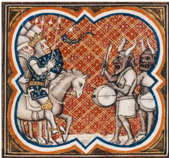
Figura 1: "Sarracenos amedrontando os cavalos dos cavaleiros franceses. Grandes Chroniques de France . Paris, década de 1370. Bibliothèque Nationale de France, Paris, MS fr. 2813, fol. 119 (detalhe)." (STRICKLAND, 2003, p. 170, tradução livre 31 ). Crônicas como as Grandes Chroniques de France eram fonte de "entretenimento, educação, instrução moral e orientação política" para membros da nobreza e aristocracia medievais (British, s.d.).