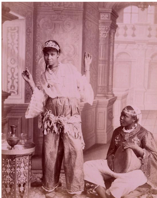
Figura 3: “Duas mulheres maometanas”, foto de estúdio produzida pela condessa de Croix-Mesnil em Beirut, por volta de 1893 (disponível no acervo do Centro de Fotografia Akkasah, da New York University Abu Dhabi; NYU, s.d.). Representadas na imagem, as sensuais e misteriosas odaliscas eram personagens recorrentes nas pinturas e fotografias orientalistas propagadas ao redor do mundo, especialmente no século 19.