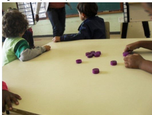
Figura 4- Foto produzida por Marcelo

As fotografias produzidas por nossos interlocutores também elucidam essa assertiva acerca das relações entre as crianças da turma: