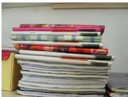
Figuras 1 e 2 - Fotos produzidas por Gabriel

Por meio das entrevistas com as crianças, foi possível perceber que as situações vividas por elas na instituição tais como “escrever”, “fazer atividade” e “aprender” predominam sobre outras vivências, tais como brincar e desenhar. A mesma predominância também apareceu nos desenhos e nas fotografias por elas produzidas: