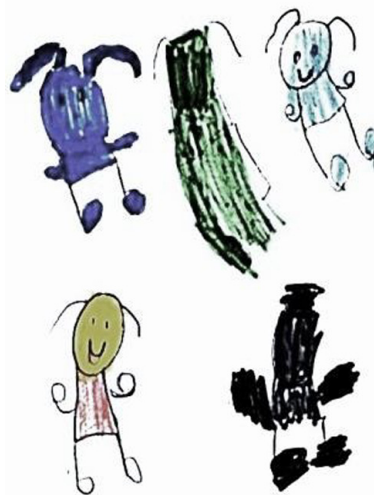
Figura 5: Brenda desenha as pessoas da UMEI de que ela mais gosta

A maioria das relações sociais vividas pelas crianças com seus pares ocorre na sala de aula, o que não quer dizer que outras relações entre pares não aconteçam em outros espaços da instituição: