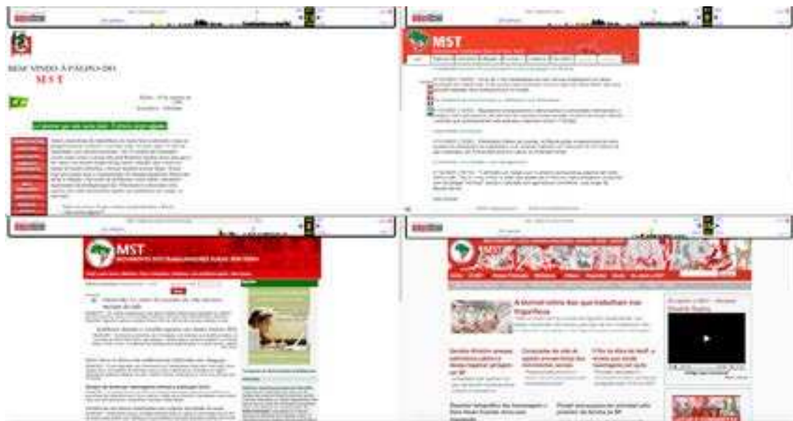
Figura 2 – Capturas de tela do site do Movimento dos Trabalhadores Sem Terra