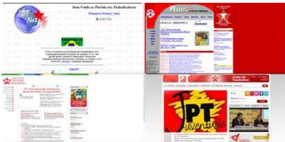
Figura 1 – Capturas de tela do site do Partido dos Trabalhadores