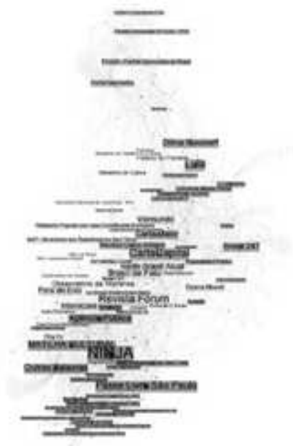
Figura 3 – Estrutura da Blogosfera Progressista

Fonte: Albuquerque; Magalhães Carvalho; Santos Jr. (2015, p. 85).