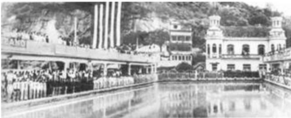
Sede do Clube de Regatas Guanabara.

O círculo vermelho marca a piscina do Clube de Regatas Guanabara, construída dentro do mar e ainda existente na agremiação.