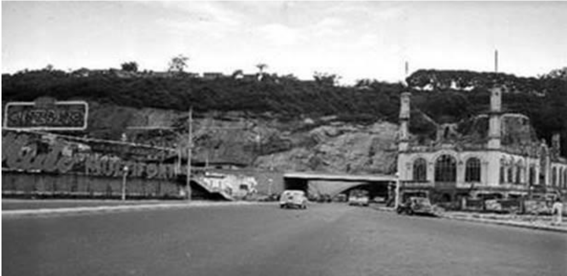
Do lado direito, sede do Clube de Regatas Botafogo; do lado esquerdo, sede do Clube de Regatas Guanabara; ao fundo o Túnel do Pasmado.

A essa altura, o Clube de Regatas Botafogo já tinha se unido com o Botafogo Futebol Clube dando origem ao atual Botafogo de Futebol e Regatas. Na imagem, marcado em laranja (no canto superior esquerdo) se encontra o mítico estádio da Rua General Severiano.