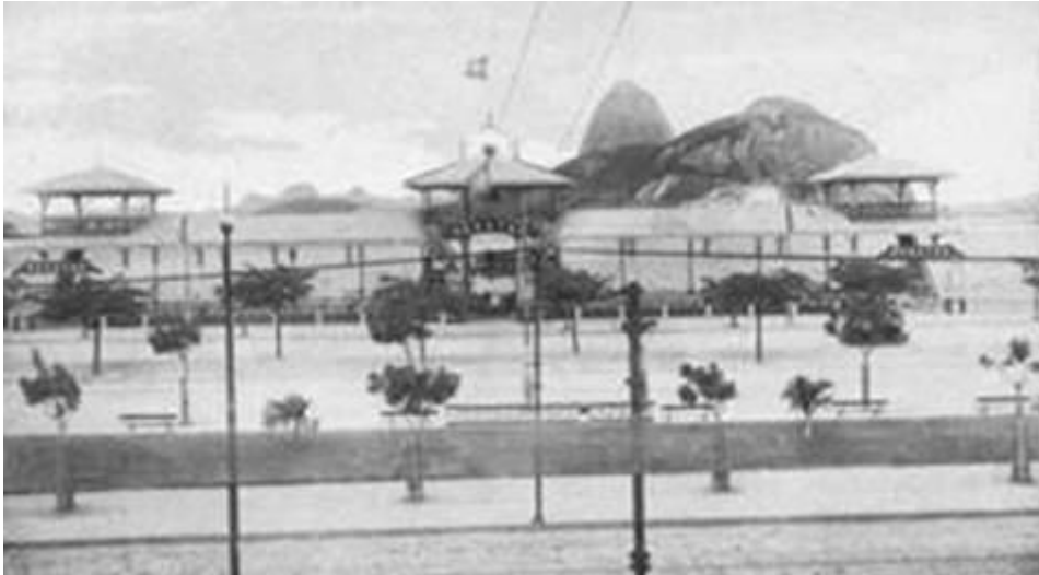
Postal de A. Ribeiro. Coleção Klerman Wanderley Lopes.

Lembremos que ali bem próximo do Guanabara e do Botafogo fora construído o Pavilhão de Regatas, uma iniciativa de Pereira Passos, inaugurado em 1905, instalado entre as Ruas D. Carlota (atual Visconde de Ouro Preto) e São Clemente, aproximadamente onde está na imagem marcado em verde (na ocasião já fora destruído).