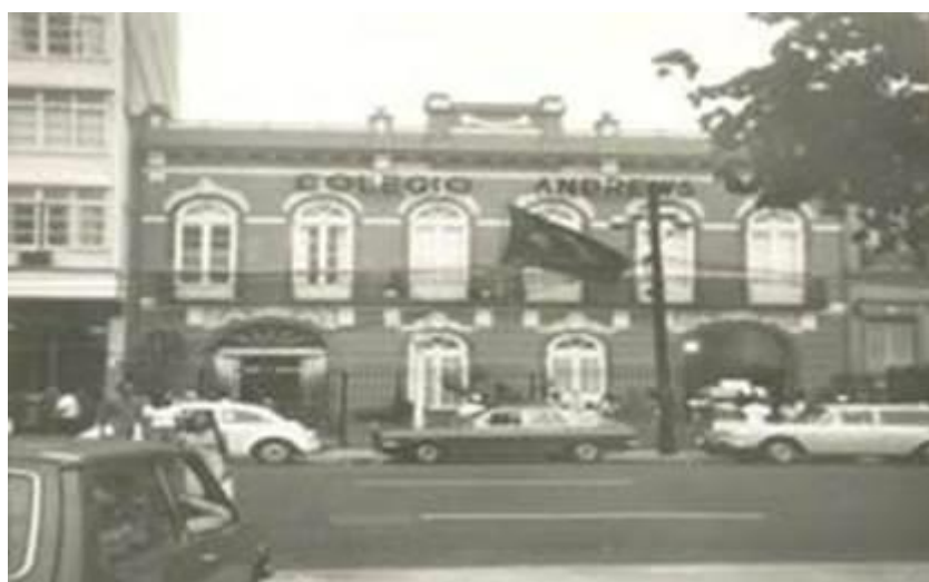
Sede do Guanabarenses ocupado pelo Andrews, década de 1970.

Bem perto do Pavilhão, na imagem apontada pela seta vermelha, se encontrava a sede de uma importantíssima agremiação, uma das mais importantes da história do remo na cidade, o Clube de Regatas Guanabarenses, fundado em 1874, dando sequência à experiência dos anteriores Clube de Regatas e Clube Guanabarenses. A última sede ainda está de pé, hoje ocupada por uma escola (durante anos foi o famoso Andrews).