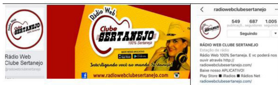
Figura 7: Perfil da rádio no Facebook e Instagram

No Instagram também não há qualquer referência à transmissão por WhatsApp e, nesta plataforma, o slogan é outro: “Rádio Web 100% Sertaneja”. Há também o link para o site e a informação da disponibilidade do aplicativo da emissora. Como rodapé fixo, há um pedido para que os usuários sigam os parceiros comerciais da emissora, acompanhado de uma lista com os respectivos endereços de perfis. A participação do público é também muito pequena no Instagram (Figura 7), com poucas curtidas e quase nenhum comentário nas postagens, que se resumem a chamadas institucionais ou da programação.