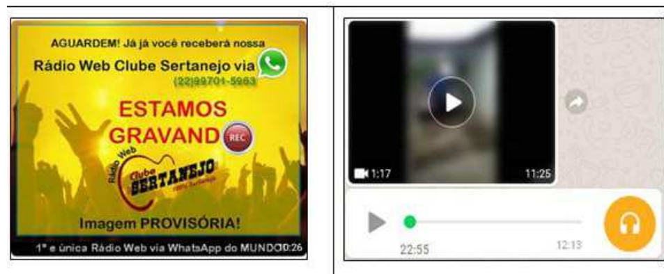
Figura 5: Programação da rádio via WhatsApp

Em média, a Rádio Web Clube Sertanejo possui pouco mais de 15.500 ouvintes, somando-se todas as plataformas de emissão, sendo 12 mil ouvintes pela internet e 3.506 pelo WhatsApp. A transmissão da programação, via WhatsApp, é gravada – geralmente um pequeno bloco com músicas, comerciais e publicidade institucional da emissora – e, logo em seguida, o arquivo é enviado. É interessante observar que a emissora avisa aos ouvintes quando uma gravação está sendo realizada e, pouco tempo depois, o arquivo é enviado, como pode ser observado nas imagens que compõem a Figura 5, a seguir: