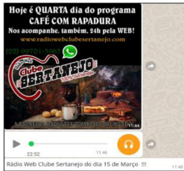
Figura 2: Programação Rádio Web Clube Sertanejo