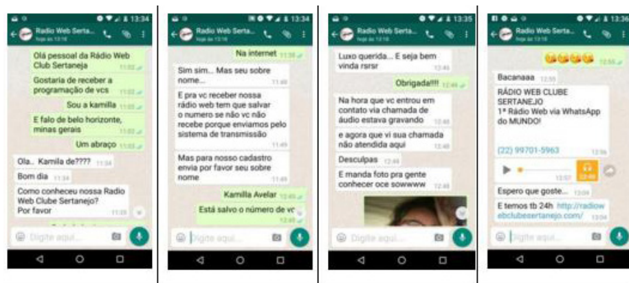
Figura 6: Primeiro contato Rádio Web Sertaneja

Não é novidade pensar que a proposta sonora deve dialogar com as características que fazem parte das plataformas comunicativas, estabelecendo um espaço multidirecional e simultâneo em que o rádio apresenta ao usuário a capacidade de interagir com o conteúdo de mídia. No caso da rádio aqui analisada, por exemplo, o primeiro contato estabelecido com a emissora é feito pelo ouvinte que, via WhatsApp, deve enviar nome, sobrenome e cidade. Ao tomar esta iniciativa o ouvinte assume a decisão de acompanhar a programação da emissora; é dele a escolha de “assinar” aquela lista de transmissão. A resposta da rádio ao pedido do ouvinte é quase imediata, como mostra a Figura 6, com uma sequência de tentativas de demonstrar a valorização da participação do ouvinte. É feita uma solicitação de informações sobre como a pessoa conheceu a emissora, além de instruções sobre como proceder para acessar a programação. Há também um pedido de envio de foto e a saudação com o slogan dito pelo DJ: “Luxo querida... que seja bem, vinda”, seguido do pedido de desculpas por não ter atendido à ligação do WhatsApp, pois a equipe estava gravando a programação.