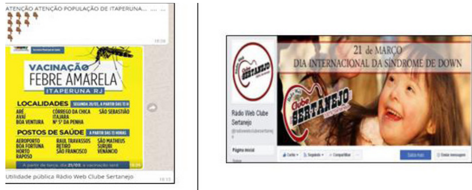
Figura 4: Prestação de serviço e campanhas sociais