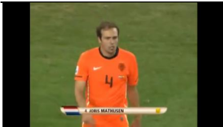
Figura 6: Galvão: “Joris Matijsen, esse não tinha ainda levado cartão amarelo.”

Entre as figuras 7 e 10, diferentes enquadramentos ajudam Arnaldo César Coelho, o comentarista de arbitragem, a informar para Galvão e para os telespectadores que o gol de Iniesta valeu. Na figura 8, inclusive, surge um tira-teima, que escurece a parte do campo onde Iniesta deveria estar para que o gol fosse invalidado.