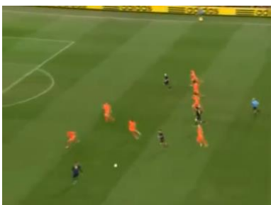
Figura 1: Galvão: “Insiste a Espanha, insiste com Navas”

A câmera principal captava as ações em um plano aberto (PG), de forma a apresentar o espaço em torno da bola. Na medida em que a bola era movimentada, a câmera a seguia, mantendo-a no terço central da tela. Desta forma, o plano sequência passava a narrar os acontecimentos do jogo (p. 113)