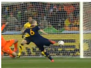
Figura 9: Arnaldo: “Gol legal! Entrou em condição e fez o gol, no primeiro lance não é para levantar a bandeira e nesse lance ele tá legal, gol legal.”