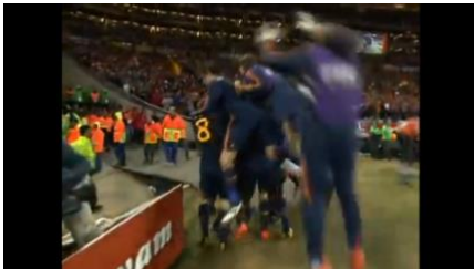
Figura 4: Galvão: “É da Espanha!” (entra a vinheta com o Hino Nacional Espanhol).

Já na figura 5, Galvão indaga a validade do gol. A câmera se aproxima do árbitro Howard Webb e o mostra conversando com os atletas holandeses. Ao mesmo tempo, a voz de Galvão com o questionamento “Será que ele vai anular o gol ou não?” ajuda a “significar ao vivo”. Ali estava sendo tomada a decisão e o composto som/imagem deixa isso bem claro.