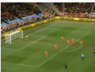
Figura 2: Galvão: “Abriu, para Fernando Torres, lançamento, tava impedido o Iniesta e o bandeira não deu. De novo ele, olha o gol, olha o gol, olha o gol, olha o gol, olha o gol...”

A partir da figura 3, diferentes enquadramentos são acionados e cada imagem carrega consigo novas informações que podem ou não ser acionadas na narração de Galvão Bueno.