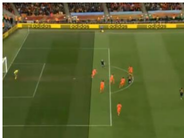
Figura 8: Galvão: “No segundo não, mas no primeiro! No segundo, posição normal, não é Arnaldo?”