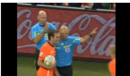
Figura 5: Galvão: “Iniesta, número meia dúzia. Será que ele vai anular o gol ou não? Correram no bandeira! Revolta holandesa! Matijssen! Eu quero ver de novo o lance! Uma Copa marcada por péssimas arbitragens, será que foi definida num erro de arbitragem?”

Já na figura 5, Galvão indaga a validade do gol. A câmera se aproxima do árbitro Howard Webb e o mostra conversando com os atletas holandeses. Ao mesmo tempo, a voz de Galvão com o questionamento “Será que ele vai anular o gol ou não?” ajuda a “significar ao vivo”. Ali estava sendo tomada a decisão e o composto som/imagem deixa isso bem claro.