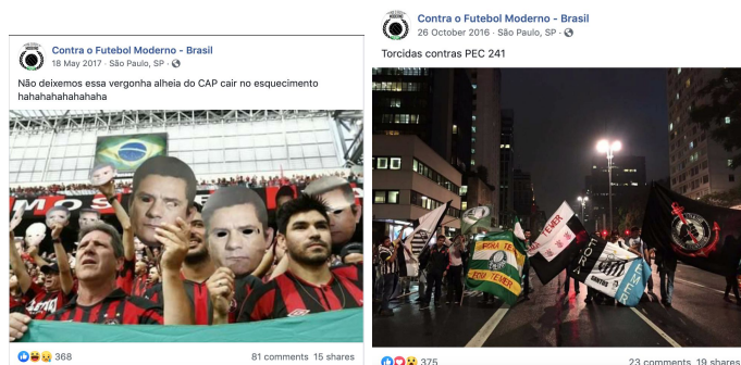
Figuras 5 e 6: Exemplos de posts codificados com subtópico “Futebol e política”

Capez foi eleito deputado estadual adotando um discurso de que combateria as torcidas organizadas.