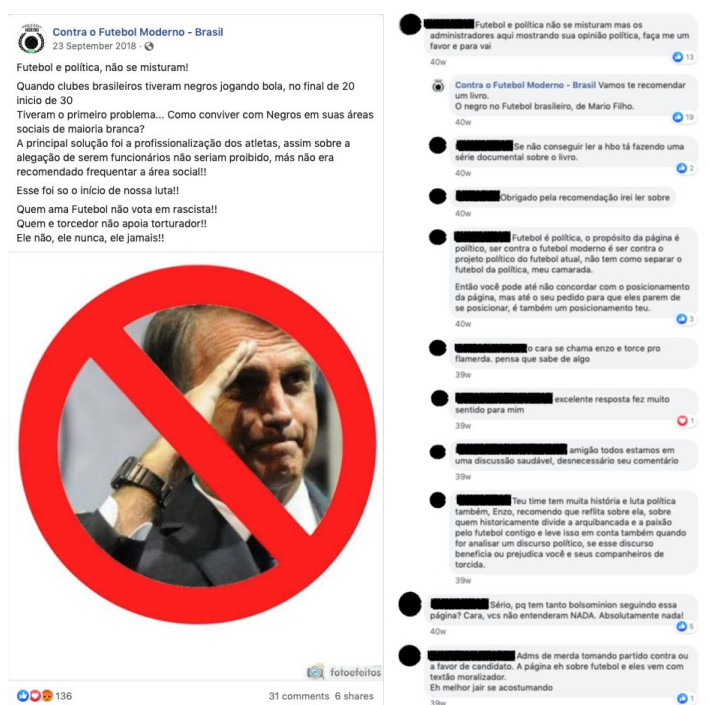
Figuras 11 e 12: Post criticando a ideia de que futebol e política não se misturam e 11 dos 31 comentários

Também é notável, nessas postagens sobre as eleições, que os administradores da página e outros torcedores buscam problematizar a questão de que futebol e política não se misturam. Particularmente, um post do dia 23 de setembro é dedicado ao assunto ao problematizar a questão a partir da história de segregação de negros dentro dos clubes de futebol brasileiros (Figuras 11 e 12). Além de argumentar em defesa ou contra a ideia de que futebol e política estão relacionados, novamente também aparecem posts afirmando a incompreensão de alguns de que ser “Contra o Futebol Moderno” é necessariamente político.