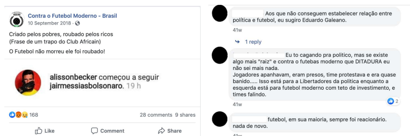
Figuras 7 e 8: Primeira postagem ligada às eleições durante o período eleitoral e três dos 28 comentários

No dia 10 de setembro de 2018, a página posta a primeira mensagem ligada às eleições dentro do período eleitoral. A mensagem questionava a escolha do goleiro Alisson de começar a seguir o candidato do PSL, Jair Bolsonaro (Figura 7). Entre os 28 comentários à mensagem, um se destaca por acreditar que não tem nada mais “raiz” que a ditadura (Figura 8).