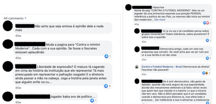
Figuras 9 e 10: Comentários ao post que critica a posição palmeirense de não punir Felipe Melo

setembro, a página divulga mensagem de apoio de torcida antifascista dedicado ao clube chileno Colo-Colo. Mais uma vez, o embate de posições aparece nas respostas ao post.