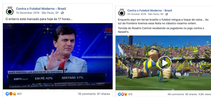
Figuras 3 e 4: Exemplos de posts codificados com subtópico “Tradições”.

Muitos desses posts lançaram mão de fotos e vídeos para ilustrar qual seria a atmosfera desejada pelos torcedores dentro do estádio, como demonstram as Figuras 3 e 4. Além desse subtópico, muito central, que já indica o que os torcedores gostariam de ver no lugar do futebol que temos hoje, também identificamos várias postagens que falavam de “Futebol e política”, de “manifestações e protestos” e da “violência policial”. Exemplos de posts que tocavam na política formal são encontrados abaixo nas Figuras 5 e 6, onde também é possível identificar que as páginas aqui selecionadas não se furtaram de expressar suas posições políticas. Também vale destacar que o tema “Chapecoense” apareceu com destaque porque os dados coletados incluíram várias mensagens relativas ao acidente que vitimou quase o time inteiro da Chape em 2016.