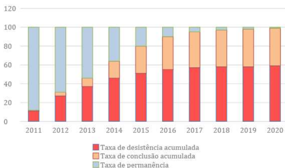
Gráfico 1: Indicadores de trajetória no Ensino Superior

Outro indicador do documento que trazemos à reflexão é a taxa de permanência. Entre 2011 e 2020 é possível perceber um aumento nos níveis de desistência e abandono dos cursos (gráfico 1). O documento aponta que, nos cursos de modalidade presencial, a permanência tende a ser maior, em comparação com os cursos à distância.