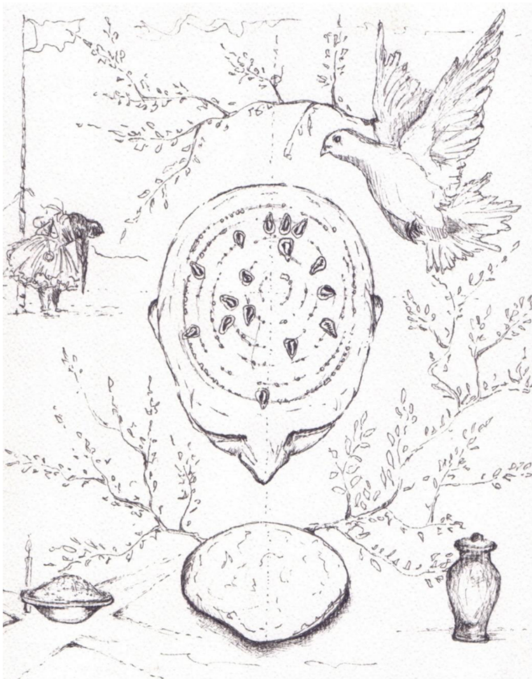
Figura 01: Corpo-território (desenho).