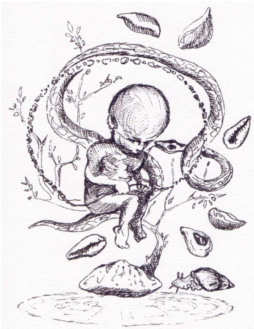
Figura 2: Etno-grafias: série Encruzilhanças (desenho).

tempo e no espaço, interferindo inclusive nas trajetórias individuais de outras pessoas. Por meio de práticas e “socialidades” (INGOLD, 2003; STRATHERN, 2014; TOREN, 2013) específicas reúnem-se divindades, pessoas, animais, plantas, minerais, cânticos, danças, vestuário, alimentação e gestos como partes de uma mesma experiência cultural. Expressões de um patrimônio cultural vivo e em constante transformação.