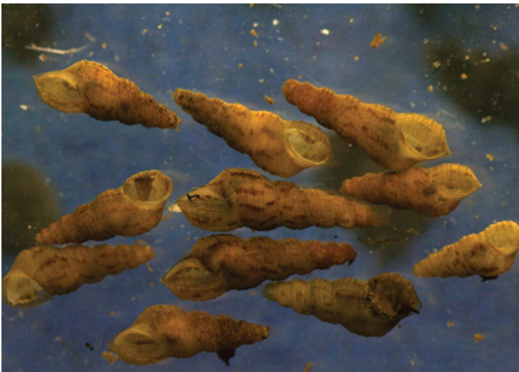
Fotografia 3 – Indivíduos de Melanooides tuberculata (Gastropoda, Thiaridae)