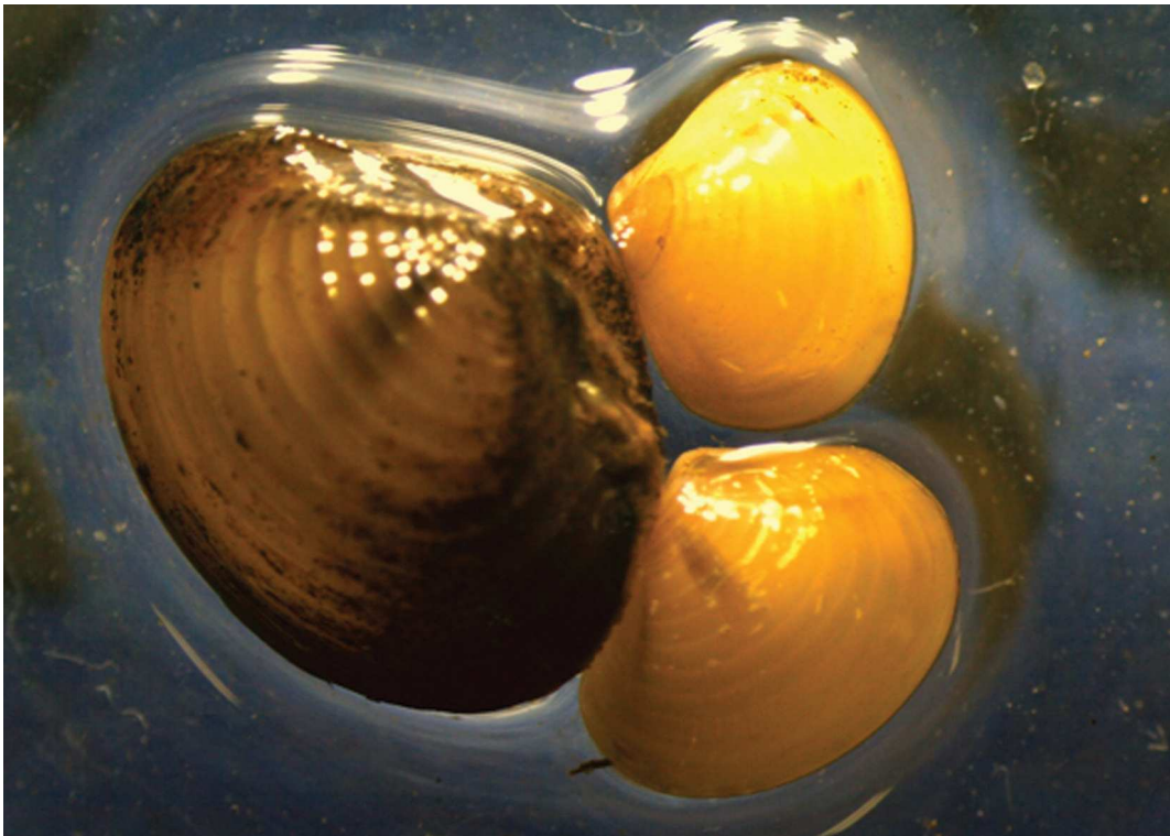
Fotografia 2 – Indivíduos de Corbicula fluminea (Bivalvia, Corbiculidae)