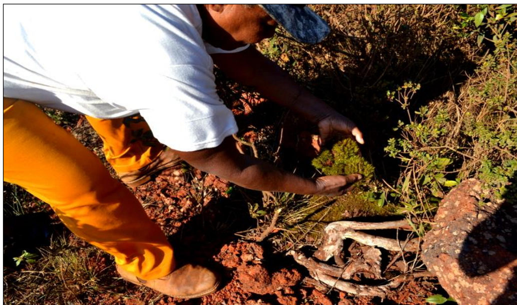
Figura 2 – Extração do musgo em sua área de ocorrência.

musgueiros se refere à rotação das áreas de coleta para deixar o musgo crescer novamente.” (ROJAS, 2014, p. 68). Os musgueiros, como também são conhecidos os coletores de musgo, (re)conhecem a importância de seu manejo de forma sustentável, pois a coleta indiscriminada do musgo poderia esgotar a sua principal fonte de renda (Figura 3).