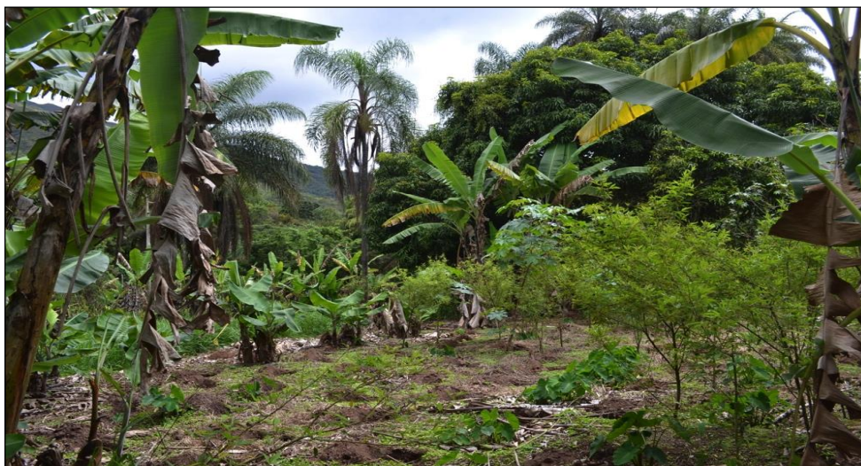
Figura 4 – Sistemas agroflorestais cultivados por lavradores na comunidade.

Conferem-se, nos relatos dos agricultores que mantêm a produção de alimentos de subsistência e comercialização do excedente, dificuldades relativas a estas mudanças profundas alavancadas pelo processo de globalização do campo. Tem-se como exemplo a integração do mercado consumidor local com os grandes produtores de regiões distantes, o que desfavorece a dinâmica comercial e sua viabilidade.