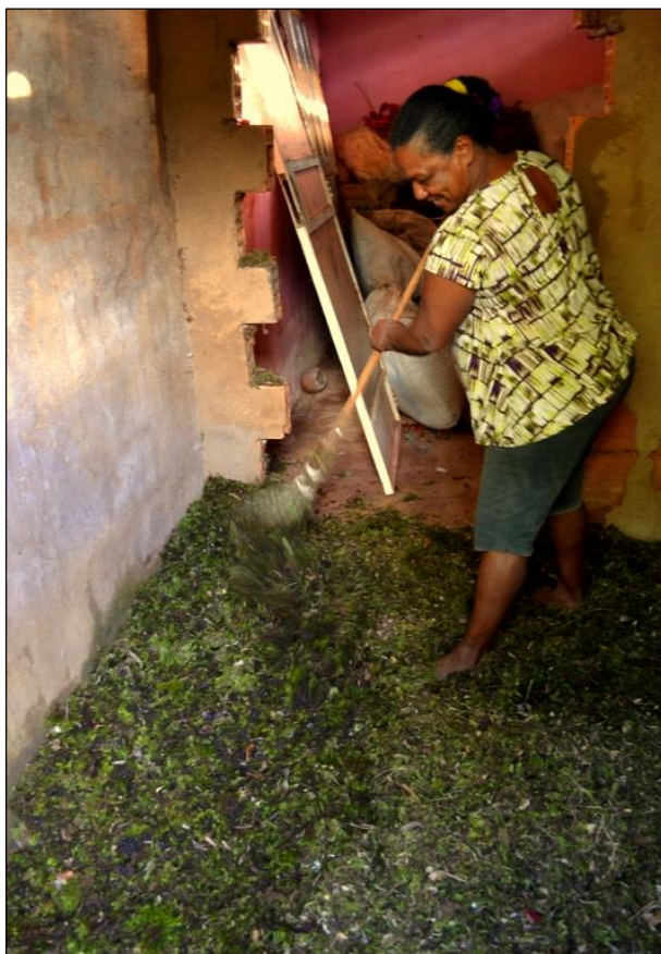
Figura 3 – Musgueira trata a matéria-prima para comercialização em Belo Horizonte

gravetos. Este processo encarece o quilo do musgo-verde, podendo ser vendido entre R$6,00 e R$8,00 5 o quilograma no local de produção. Se não for realizada pelo musgueiro, esta tarefa será repassada para o sujeito seguinte da cadeia de produção, o atravessador ou intermediário. A etapa seguinte consiste na embalagem do musgo em sacos de linhagem para ser transportado para a cidade.