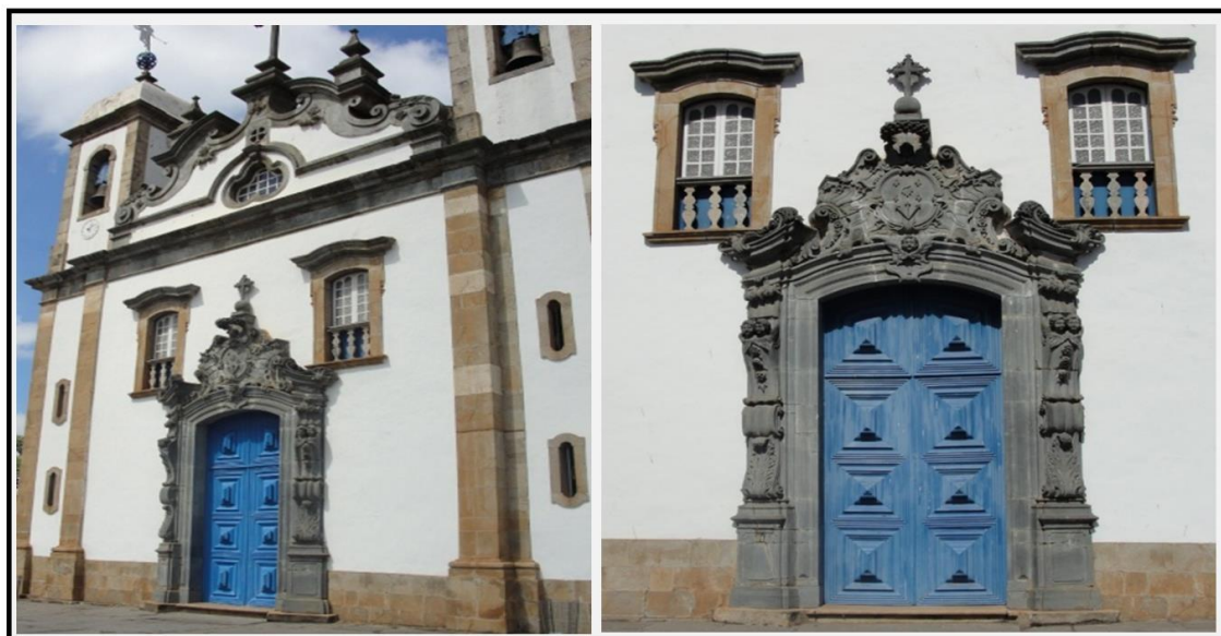
Figura 1. - Frontispício do Santuário Bom Jesus do Matosinhos. À esquerda, fachada contendo elementos construídos com a utilização de granito e à direita, destaque para a portada construída com a utilização de esteatito, texturalmente homogêneo e com coloração cinza escura predominante.

IGREJA: A igreja foi construída na segunda metade do século XVIII e constitui importante exemplar da arquitetura colonial brasileira. Construída em estilo rococó, apresenta rica decoração interna com madeiramento e talhas pintadas ou douradas. Na produção de ornatos e outras peças decorativas foram empregados esteatitos, enquanto granitos foram utilizados para a produção de elementos de sustentação (Figura 1) tais como: colunas, pilares, cunhais e bases. Os esteatitos da parte externa da igreja ocorrem na portada principal, assim como em cimalkas, ombreiras, vergas, quartelões, óculos, cruzes, flores, folhas, anjos, cartelas e escudos. Na igreja, a observação macroscópica foi realizada com detalhe principalmente na portada principal, já que os outros elementos estão dispostos em alturas que impossibilitam essas descrições. A portada é composta por muitos detalhes decorativos e por se tratar de um elemento muito importante para o conjunto, provavelmente os artesãos tiveram muito rigor na escolha das peças envolvidas na sua preparação. O material pétreo apresenta grande homogeneidade textural, representada por unidade cromática, com coloração cinza escura predominante, ausência de orientações preferenciais e estrutura maciça. Da descrição observa-se que a rocha utilizada apresenta conteúdos mais elevados em talco e clorita, sendo identificada como esteatito (Figura 2).