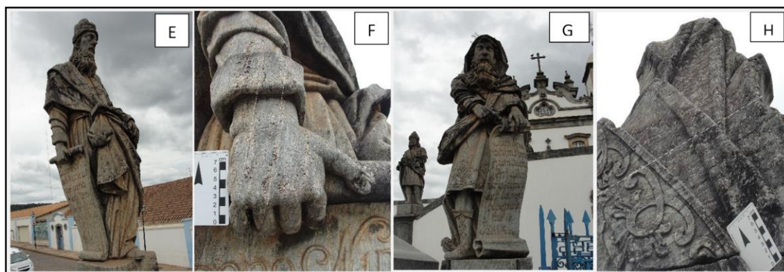
Figura 5. Nahim (E e F) e Isaias (G e H) apresentando foliação milonítica (notar sentido do tracejado branco), este último somente na parte superior do bloco. A foliação, bem marcada em alguns, mostra-se, às vezes, paralela ao bandamento marcado pela presença de níveis esbranquiçados e constituídos preferencialmente por talco, ora pela cor cinza contendo serpentina e clorita (fotografias - Neves 2016).