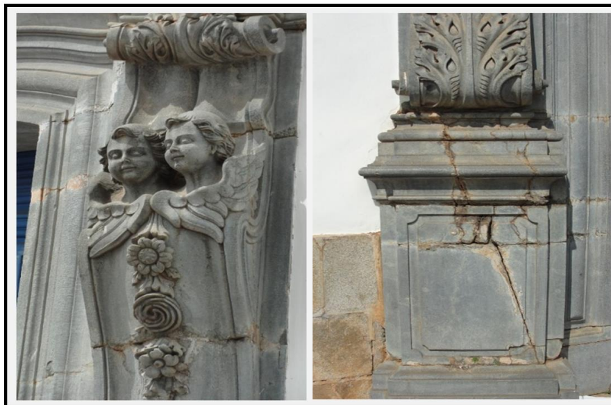
Figura 2. Portada com presença de esteatito maciço, mostrando granulação fina e coloração cinza escura. Notar fissuras na base esquerda da portada causadas possivelmente por compressão.

ADRO: O adro foi construído entre 1795 e 1805 e nele destaca-se o conjunto composto por 12 esculturas que simbolizam os profetas, dispostos harmoniosamente ao longo de sua escadaria principal e murada frontal (Figura 3). Além dessas esculturas, murada e escadaria, encontram-se ainda uma cartela e o piso, todos esculpidos e talhados em esteatitos. De todas as esculturas e elementos descritos, as maiores variações texturais e mineralógicas estão presentes nos profetas. A maioria foi talhada com a utilização de 2 blocos, salvo Amós, Jonas e Daniel e por esse fato, essas esculturas apresentam homogeneidade textural (Figura 4). Já as outras, esculpidas em 2 blocos, apresentam variações texturais, estruturais e mineralógicas marcantes. Além dos blocos maiores colocados nas partes inferior e superior, também são observadas peças menores que compõem as mãos, os capacetes, a base e outros elementos. De um modo geral, os esteatitos são predominantemente deformados e foliados, por