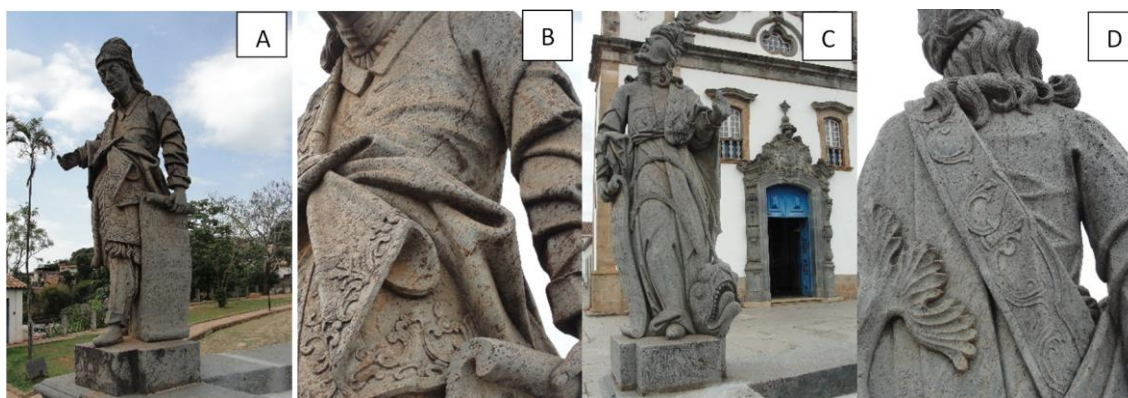
Figura 4. Amós (A e B) e Jonas (C e D) talhados em 1 bloco, apresentando homogeneidade textural nas peças utilizadas (fotografias - Neves 2016).