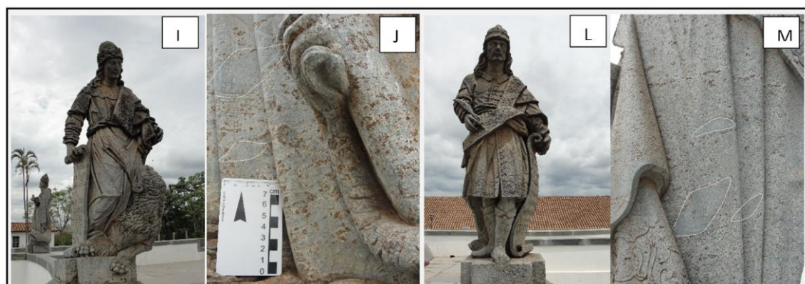
Figura 6. Daniel (I e J) e Oséias (L e M) apresentando foliação com padrão anastomosado e "boudins" contendo talco e serpentina. Notar a grande concentração de sulfetos (em castanho) presentes nessas rochas.