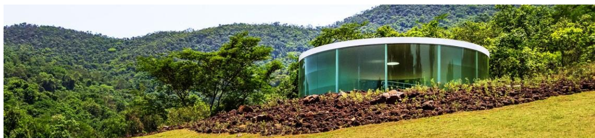
Figura 10: Exposição no Instituto Inhotim.

Acesso: Fácil. Existe uma estrada bem sinalizada que permite a ônibus, vans e carros de passeio chegarem até a portaria do Instituto, onde há um amplo estacionamento.