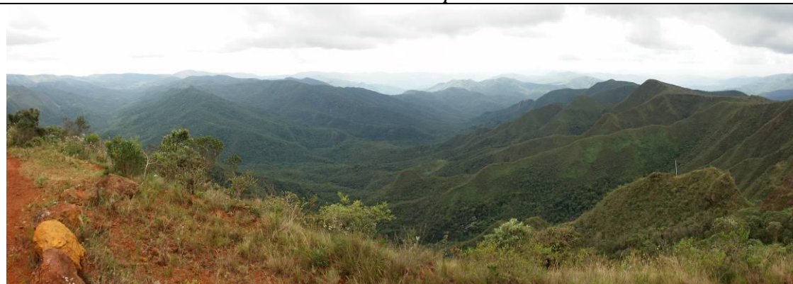
Figura 6: Sinclinal Suspenso do Gandarela

Acesso: Razoável. Sítio atravessado por estrada interna do Parque Nacional da Serra do Gandarela. Entretanto, esta estrada não está pavimentada, alguns trechos que percorrem o sítio necessitam de melhorias para possibilitar o tráfego de veículos.