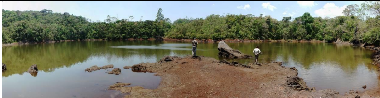
Figura 7: Exposição de canga na lagoa do Metro

Acesso: Razoável. Sítio localizado na margem de estrada que faz a ligação entre municípios. Entretanto, esta estrada não está pavimentada, apresentando trechos necessitando de melhorias para o acesso de ônibus.