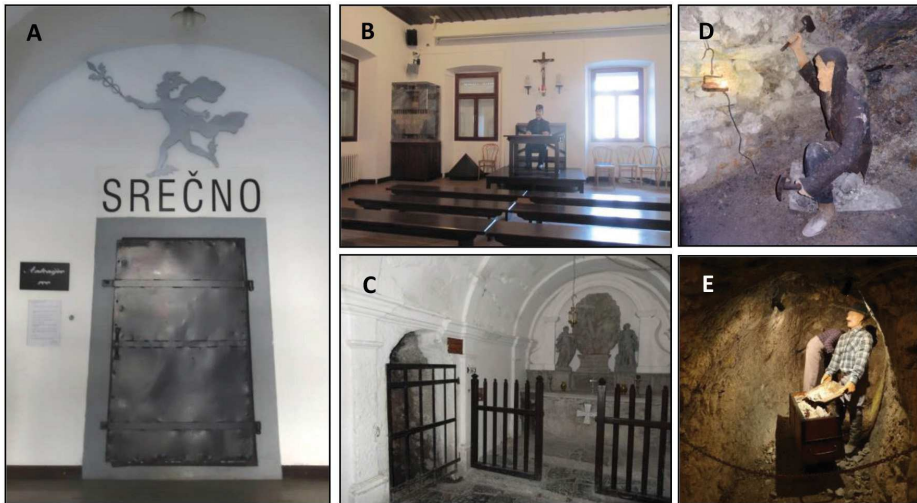
Figura 3. Aspectos da mina de mercúrio de Idrija e as estratégias adotadas para fruição do patrimônio: (a) Entrada da mina de Idrija com a palavra “Sorte” escrito em esloveno; (b) Local onde é apresentado o vídeo que conta a história da mina; (c) Capela da Santíssima Trindade com o local original de entrada dos mineiros. Hoje é por onde os turistas saem após o final da visitação; (d) Representação de um trabalhador e sua condição de trabalho durante a Idade Média; (e) Manequim em escala 1:1 com roupas e condições de trabalho da década de 60/70.

Ao organizar parte da mina para visitas turísticas, os gestores se preocuparam em reproduzir para os visitantes as condições de trabalho e o próprio trabalho na mina, bem como exibir o mercúrio e os minérios encontrados na região. Há vários anos a equipe tem dedicado atenção especial a grupos de especialistas como estudantes de engenharia de minas, geologia e ciências afins, o que já ocorria enquanto a mina estava ativa. Eram comuns as visitas de alunos da Universidade de Ljubljana, bem como de outras universidades europeias como as de Munique, Heidelberg, Karlsruhe, Viena, Leoben, Innsbruck, Trieste, Paris e Liege. Entre as atividades destaca-se a possibilidade de aulas de campo dedicadas ao mapeamento geológico subterrâneo. O programa inclui trabalho de campo teórico e prático, o que raramente é oferecido aos estudantes em outros lugares. Na Figura 3 são apresentadas várias estratégias de utilização do patrimônio geológico e mineiro adotados na visita à Mina de Idrija.