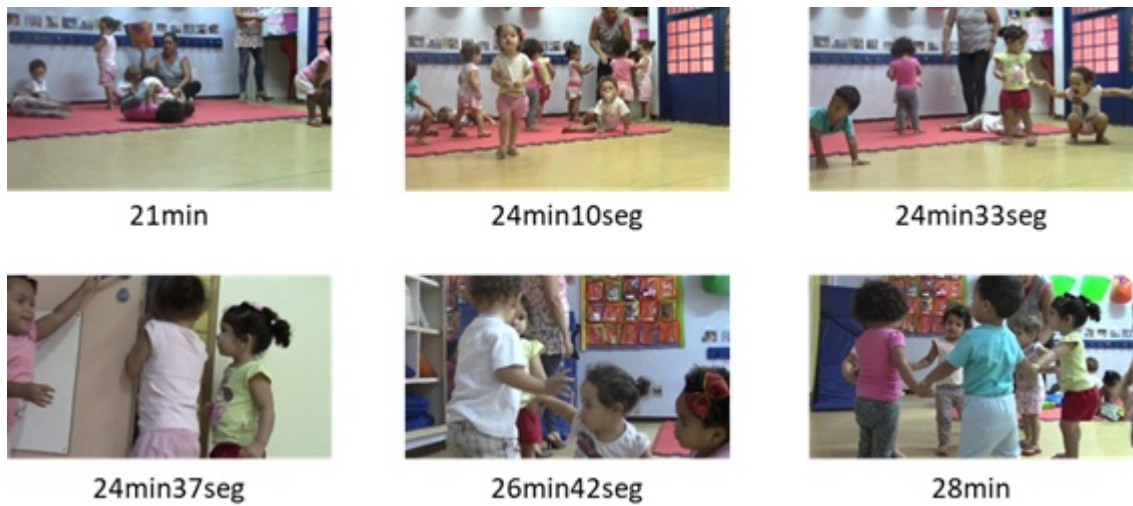
□ Figura 4: Simone enlaça crianças e professora na brincadeira de roda (02/04/18).

A pesquisadora que estava observando e filmando a turma nesse dia (Fig. 4), comenta: