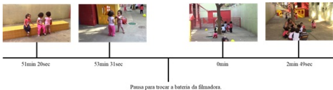
□ Figura 5: Focalizando a brincadeira de roda.

No dia 06/06/20 (Fig. 5), torna-se perceptível que as ações da pesquisadora em campo foram transformadas pela retomada das filmagens e pelas reflexões coletivas.