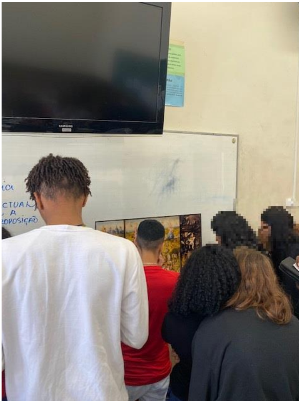
Fig. 4: Momento de observação da reprodução da obra por alunos para ilustrar como os alunos saíram de suas carteiras para se aproximarem fisicamente da imagem (os alunos da fotografia acima foram de uma turma diversa da escolhida para o presente relato de experiência, pois, por lapso, perdi o momento de registrar, por fotografia, a observação dos alunos da turma escolhida para este relato em razão de os estar acompanhando e respondendo dúvidas sobre a atividade no exato momento desta observação).