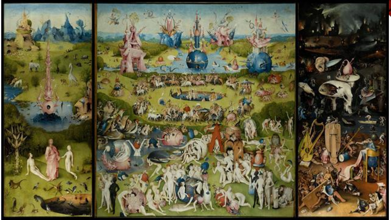
Fig. 1: O Jardim das Delícias, 1500-05, óleo sobre madeira, painel central 220 x 195 cm, painéis laterais 220 x 97 cm, Hieronymus Bosch, Museu do Prado, Madri.

A atividade foi conduzida conjuntamente pela residente e pela Prof. a Preceptora, que desenhou na lousa um quadro com os campos “hipótese”, “argumentos” e contra-argumentos”. Dividiu-se a turma em dois grupos devido ao grande número de alunos, entre trinta e quarenta. Os alunos foram informados de que deveriam se levantar de suas cadeiras e se aproximar fisicamente, com os demais integrantes de seu grupo, das duas lousas onde se encontravam, apoiadas, duas reproduções de O Jardim das Delícias , em painéis de papel couché brilhoso aplicado em papel-cartão paraná em tamanho de 84 cm X 47cm.