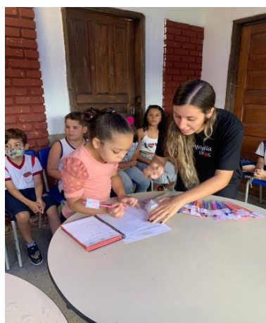
Figura 3: Tarde de autógrafos com as crianças.