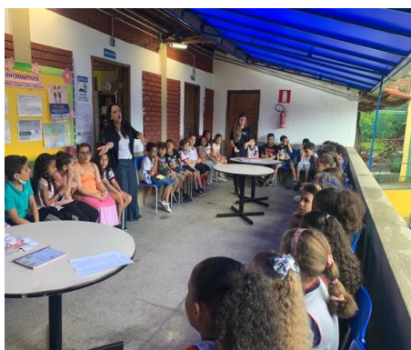
Figura 2: Lançamento do livro das turmas.

crianças pudessem assinar seus nomes, além disso, as crianças leram suas adivinhas para outras turmas da escola. A ação, além de mobilizar os educandos, contou com a presença das professoras regentes de cada turma, da bibliotecária escolar e da coordenação pedagógica da escola.