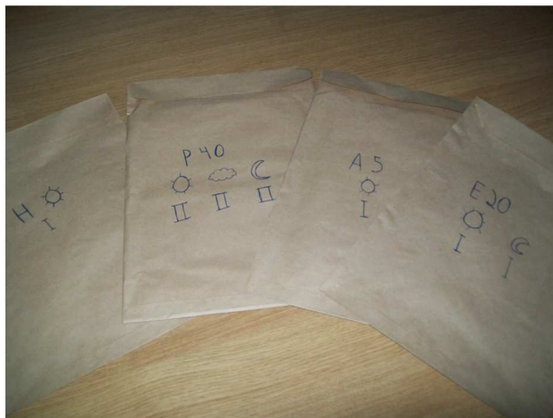
Figura 2: Envelopes contendo medicamentos prescritos com respectiva representação lúdica da posologia.

Salienta-se a limitação amostral da experiência e sugere-se a realização de outros estudos, cujas amostras sejam maiores, que possam confirmar os resultados apresentados, bem como testar outras estratégias educativas a fim de melhorar a adesão desses pacientes ao tratamento da Hipertensão Arterial Sistêmica.