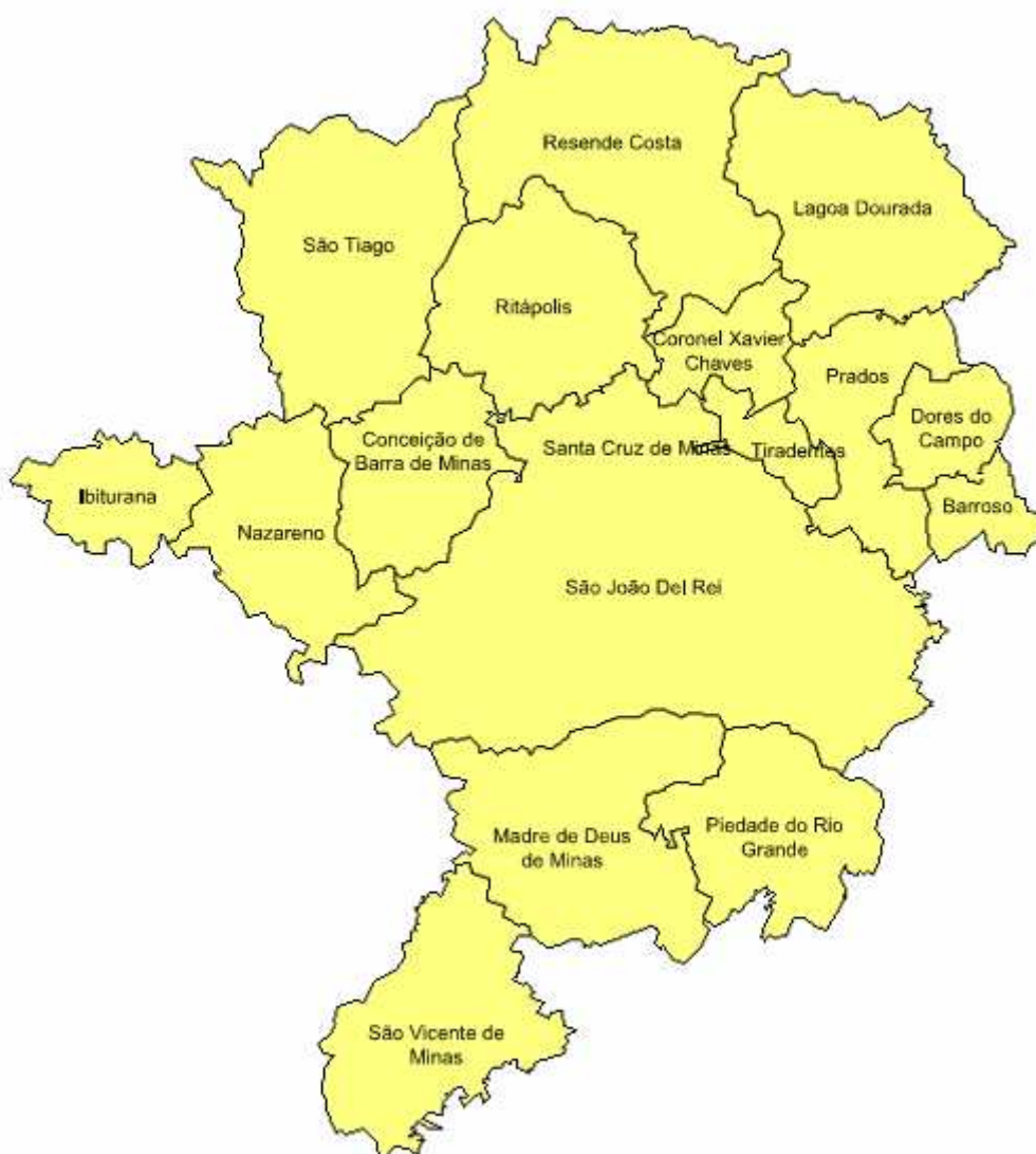
Figura 04: Microrregião São João Del Rei