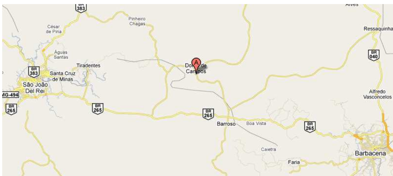
Figura 01: Localização do município de Dolores de Campos – MG.

Dolores de Campos é uma cidade situada no Campo das Vertentes, no estado de Minas Gerais, com uma população total de 9.299 habitantes, sendo 8.457 residentes na área urbana e 842 na área rural (IBGE, 2010). A cidade possui apenas um distrito, ou seja, o distrito sede. Encontra-se a 220 km da capital do estado, Belo Horizonte e integra a região da Trilha dos Inconfidentes e a rota da Estrada Real.