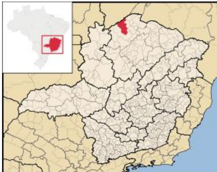
Figura 1 – Localização da microrregião de Januária: Módulo Assistencial

Bonito de Minas a Chapada Gaúcha: 130 km