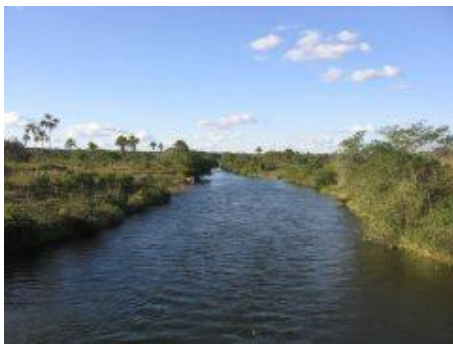
Figura 3 - Rio Carinhonha