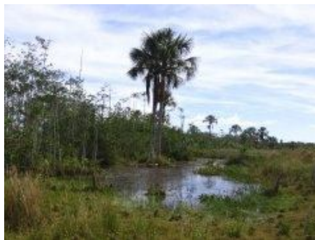
Figura 4 -Veredas do Gibão

A grande dimensão territorial municipal e as barreiras geográficas como terrenos arenosos são as principais dificuldades que a Secretaria Municipal de Saúde e os profissionais de Saúde enfrentam ao desenvolver ações de saúde com qualidade e igualdade de atendimento aos usuários, além das condições precárias das estradas.