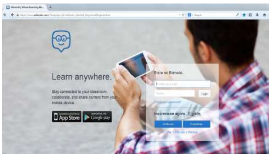
Figura 1: Página de cadastro da plataforma

Se o cadastro é para estudantes, o primeiro passo é colocar o código do grupo que é fornecido pelo professor, em seguida o nome de usuário, a senha de no mínimo 04 dígitos, nesse caso o e-mail é opcional e finaliza com o nome e sobrenome.