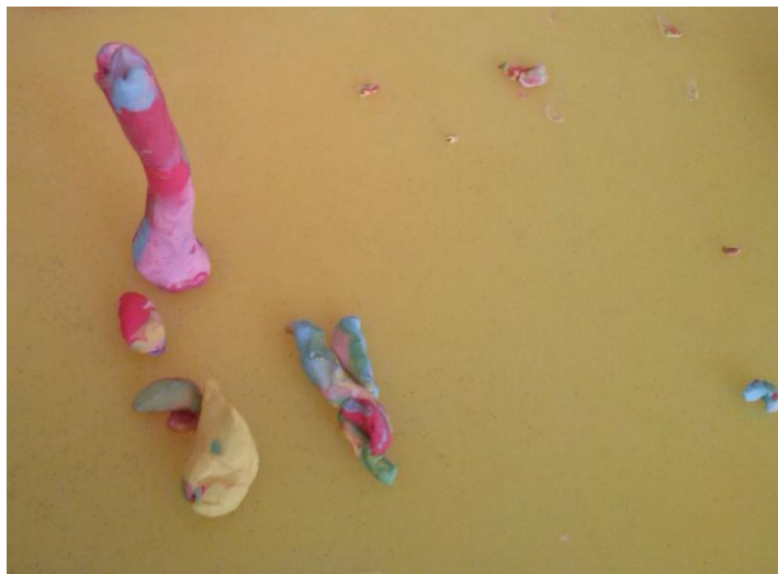
Figura 9 – Modelagem feita por aluno da Creche I