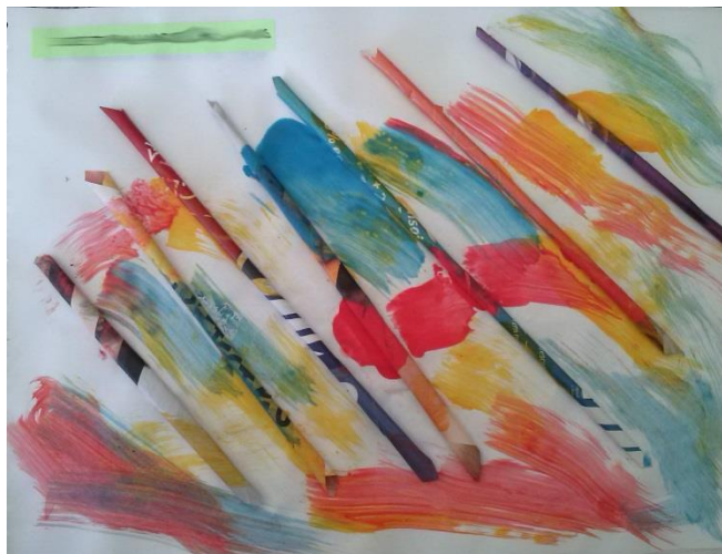
Figura 7 – Pintura sobre canudos de papel feita por aluno da Creche I