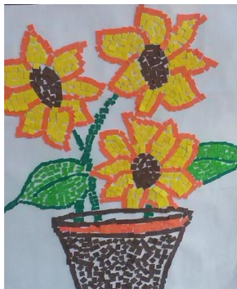
Figura 1- Releitura de Van Gogh em mosaico feita por aluno da Creche III