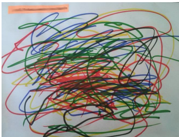
Figura 10- Desenho livre feito por aluno da Creche I