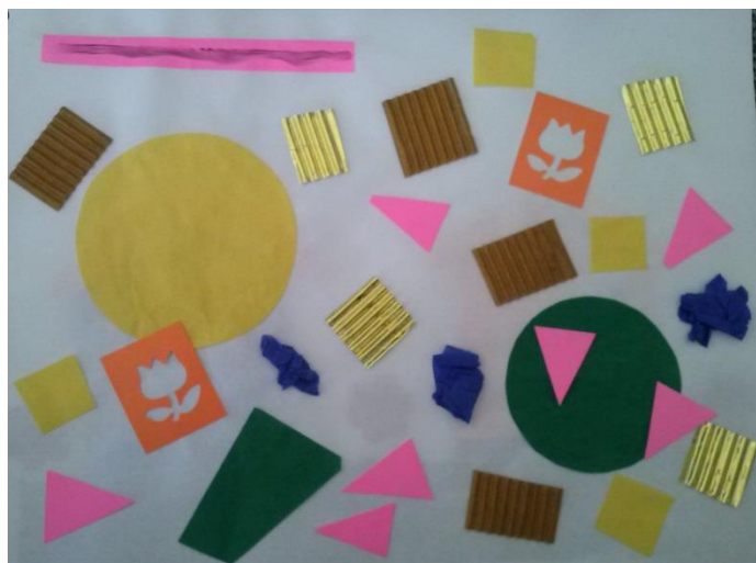
Figura 3 –Atividade de colagem feita por aluno da Creche I