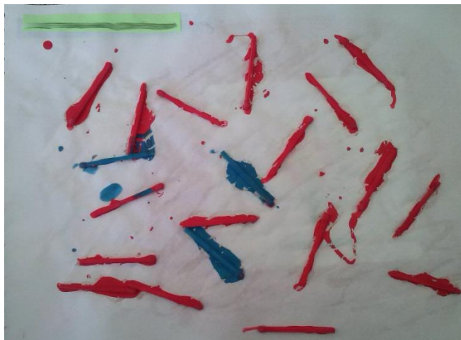
Figura 2- Pintura com palitos de fósforo feito por aluno da Creche I