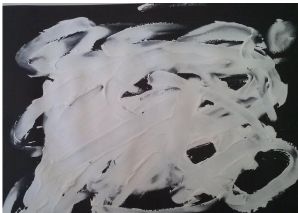
Figura 5 – Pintura com creme dental feita por aluno da Creche I