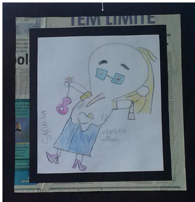
Figura 8 – Desenho Vinicius de Moraes feito por aluno do 1º Período