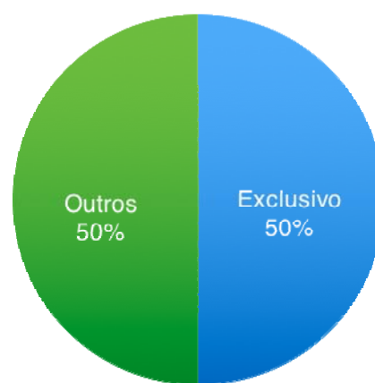
Gráfico 2 Número de Crianças de 0 - 6 meses em Aleitamento Materno Exclusivo na ESF Bandeirantes no ano 2015