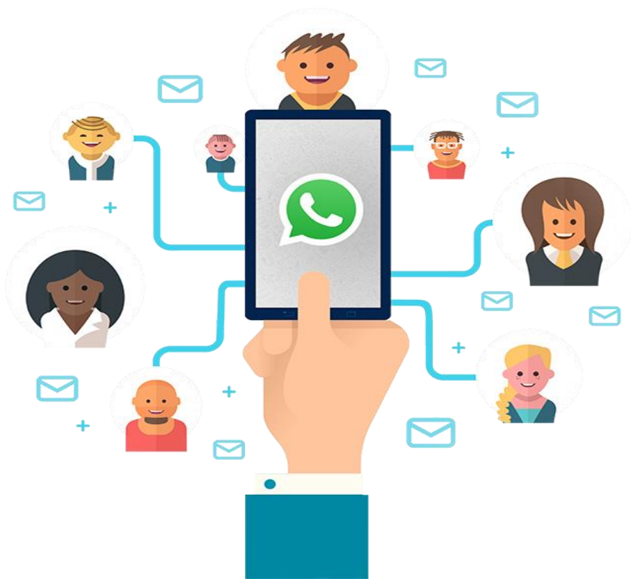
Figura 01- WhatsApp e comunicação