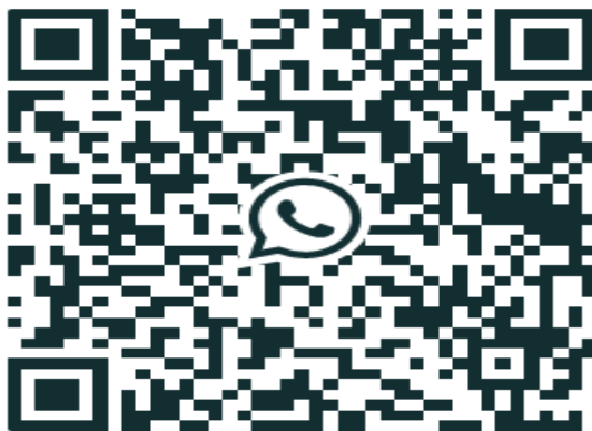
Figura 5 – QR Code