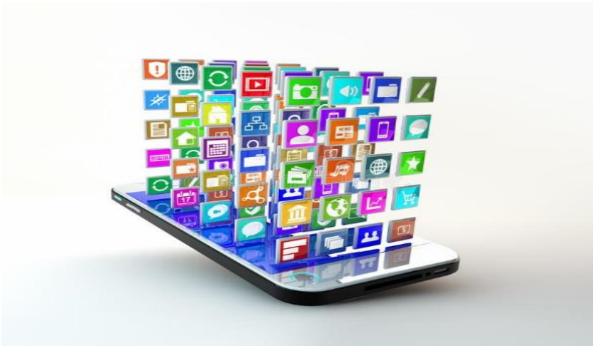
Figura 02- Telefone celular com representação da nuvem

A sequência didática WhatsApp na sala de aula: como potencializar a aprendizagem da Língua Portuguesa destina-se aos professores de Língua Portuguesa, e tem duração prevista de 05 (cinco) semanas com 02 (dois) encontros semanais.