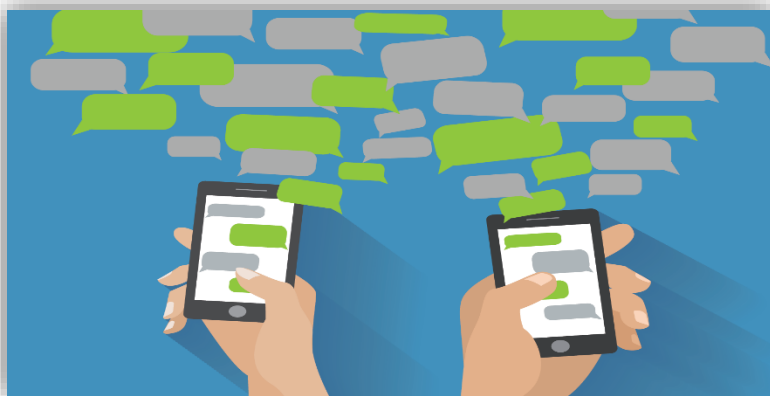
Figura 3 - WhatsApp Business