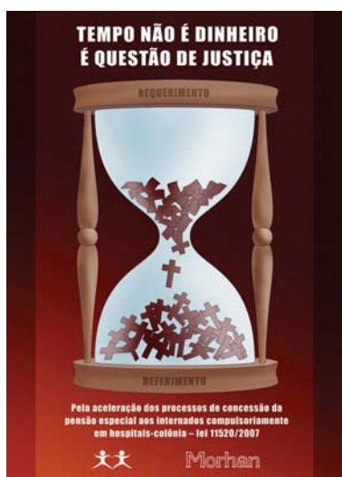
Ilustração 1: Cartaz produzido pelo Morhan solicitando a aceleração dos processos indenizatórios

Os antigos moradores de colônias começaram, então, a encaminhar os requerimentos à SEDH, sendo que a análise dos processos segue o critério da prioridade de idade. O primeiro lote de pensões foi divulgado em dezembro de 2007, e, desde então, 2574 processos foram deferidos em 45 lotes. 12 No entanto, os protestos para a aceleração continuam (vide Ilustração 1). No dia 20 de fevereiro de 2008, uma comitiva do Morhan reuniu-se com representantes da SEDH para tratar do assunto, o que se repetiu em junho do mesmo ano. Outro ato público envolvendo cerca de 170 pessoas foi organizado pelo movimento em 10 de setembro. Nessa época, segundo dados do Morhan, apenas 6% das 9,2 mil solicitações haviam sido contempladas. Houve também protestos contra a interpretação do INSS de que a indenização não poderia ser acumulada a benefícios de caráter assistencial pagos pelo órgão. 13