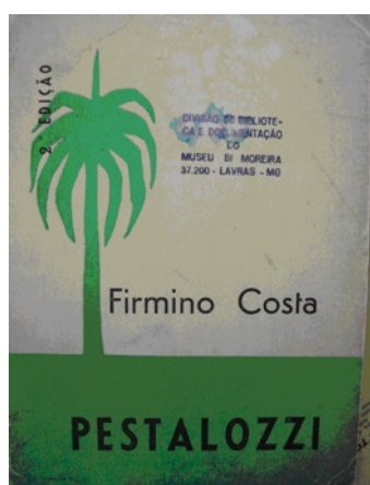
Capa do opúsculo Pestalozzi – 1965

O presente trabalho se propôs a investigar as concepções educacionais de Firmino Costa (1869 – 1939) por meio da análise de seus textos publicados. O fio condutor desse percurso foi o trânsito de suas concepções acerca do método intuitivo para o ativismo educacional, sempre na perspectiva da dinâmica da apropriação e circulação de idéias, como forma de produção da cultura escolar em Minas Gerais. O tratamento das fontes foi ancorado em três grandes períodos, os quais estão relacionados aos deslocamentos de Firmino Costa, entre os lugares a partir dos quais os discursos são produzidos e veiculados. Cada um desses lugares representa um momento específico na trajetória de Firmino Costa com atribuições, at-