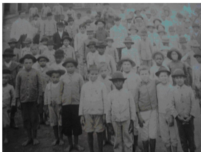
Alunos do Grupo Escolar de Lavras

os três tempos às respectivas publicações e deslocamentos, isto é, aos lugares a partir dos quais os textos publicados foram produzidos. A proposta foi a de realizar uma análise de sua obra e atuação educativa, ou seja, a formação do seu pensamento político e educacional no contexto recente da República, com uma atuação diferenciada e ricas contribuições para o debate educacional de Minas Gerais, sobretudo no que diz respeito à instituição de uma cultura escolar, orientada pela concepção de escola ativa. Ao mesmo tempo, compreender, através de suas relações e interlocuções, como as concepções educacionais que pronunciavam novas práticas educacionais foram produzidas e postas em circulação, em Minas Gerais, nos anos iniciais do século XX.