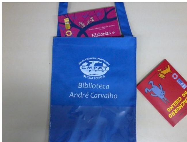
FIGURA 3 – Bolsa para levar o livro para casa

garantir que ele estará bem protegido no trajeto da escola para casa, e enquanto este estiver em posse do aluno (FIG. 3).