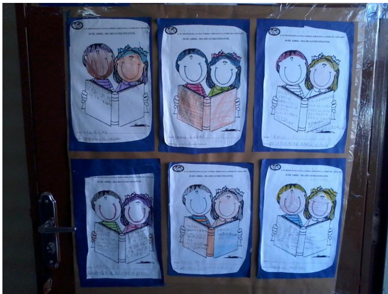
FIGURA 5 – Frases produzidas sobre os cuidados com os livros